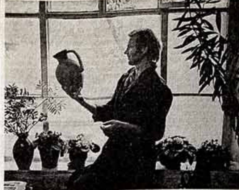
Не одному десятку высокохудожественных керамических изделий для жемчужины художественной керамики Борисовской фабрики...