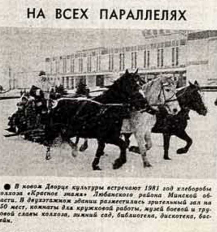
В новом Дворце культуры встречают 1981 год хлаборбы колхоза «Красное знамя» Лобановского района Микской области. В двухэтажном здании разместился зрелищный зал на 350 мест, кожаный блк кружковой работы, музей боевой и трудовой славы колхоза, личный сад, библиотека, дискотека, бассейн.