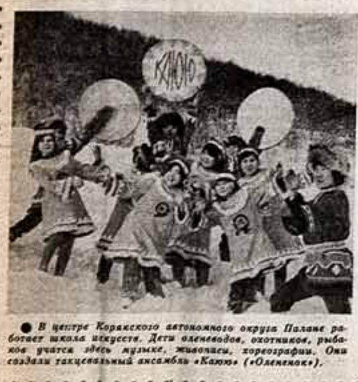
В центре Коржикского автономного округа Палане работает школа искусства. Дети оленеводов, охотников, рыбаков учатся звать музике, живописи, хореографии. Они создали табуны танцевальный ансамбль «Кайо» (Ю. Селезнев).