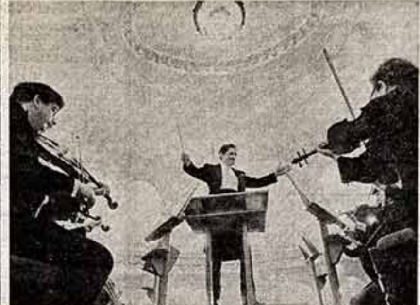
Год живущий был ознаменован укреплением дружбы между народами нашей страны и Индии. Премию имени Джавахарлала Неру получил народный артист СССР...