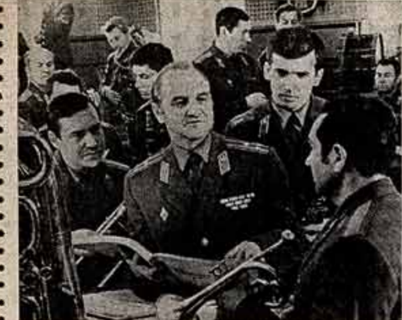
Отдельный показательный оркестр Министерства обороны СССР — от его мастеров во многом зависит ритм движения и красота строя участников парада на Красной площади...

А. СТЕПАНЕНКО, корр. ТАСС — специально для «Советской культуры» ЛОНДОН.