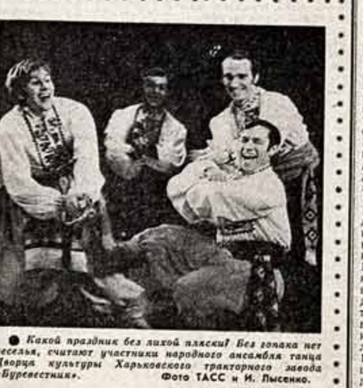
Какой праздник без легкой пляски! Без танца нет веселья, считают участники народного ансамбля танца Дворца культуры Харьковского тракторного завода «Буревестники».