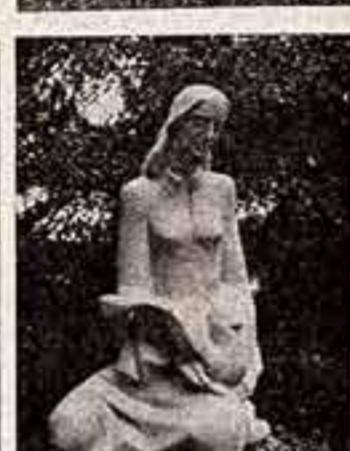
В Риго открылась традиционная выставка садовой и парковой скульптуры...