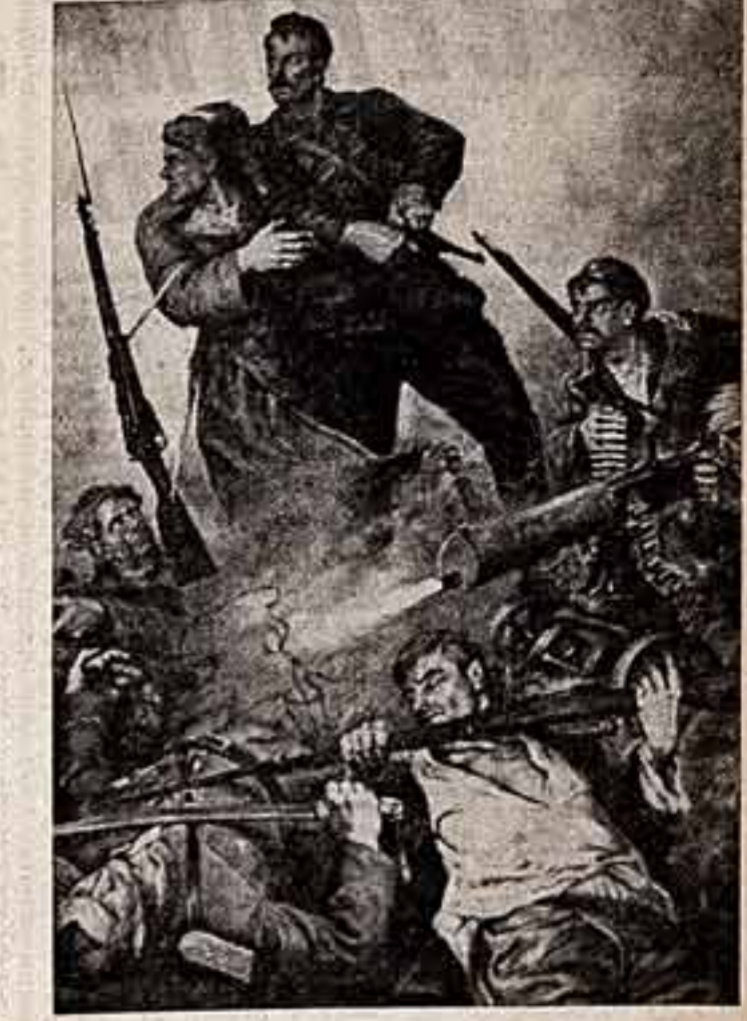
«Гибель героя». (Правая часть триптиха «Щорс».)