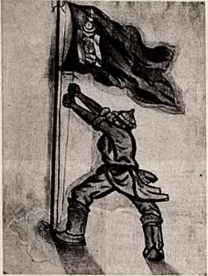
Народных организаций. В 1981 году флаг МНР был поднят перед зданием ООН.

Постоянно прекрасные сдержания братской страны во всех областях экономики и культуры. Последовательная, глубоко миролюбивая политика той же страны — это великая заслуга и национальная гордость всего монгольского народа.