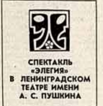
СПЕКТАКЛЬ «ЭЛЕГИЯ» В ЛЕНИНГРАДСКОМ ТЕАТРЕ ИМЕНИ А. С. ПУШКИНА