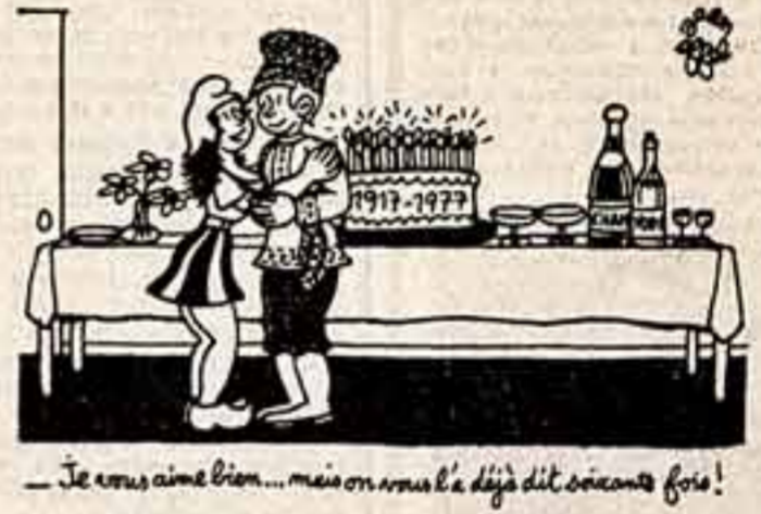
Je vous aime bien... mais on n'est le dix dit souvent fois!