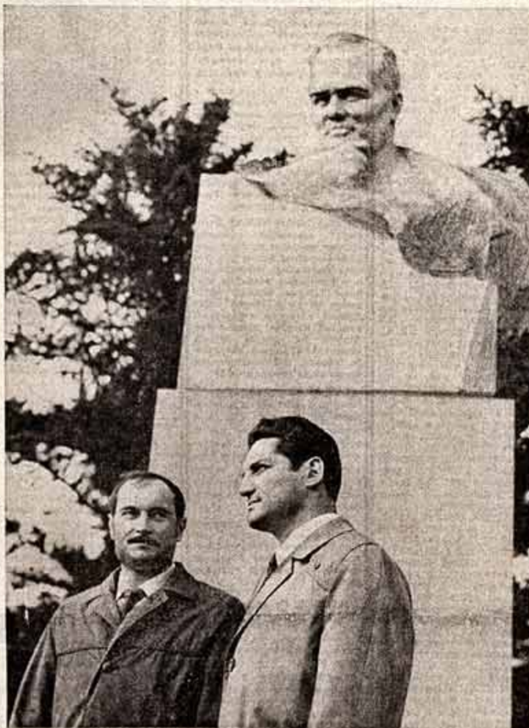
Экипаж космического корабля «Союз-21» — командир корабля летчик-космонавт СССР В. В. Волинов и бортинженер В. М. Жолобов у памятника С. П. Королёву.

ТАСС СООБЩАЕТ: В ПОЛЕТЕ — «СОЮЗ-21» ● ПИЛОТИРУЮТ КОРАБЛЬ В. В. ВОЛИНОВ И В. М. ЖОЛОбОВ ● СОСТОЯЛАСЬ СТЫКОВКА СО СТАНЦИЕЙ «САЛЮТ-5» ● ЭКИПАЖ ПРИСТУПИЛ К ВЫПОЛНЕНИЮ ПРОГРАММЫ.