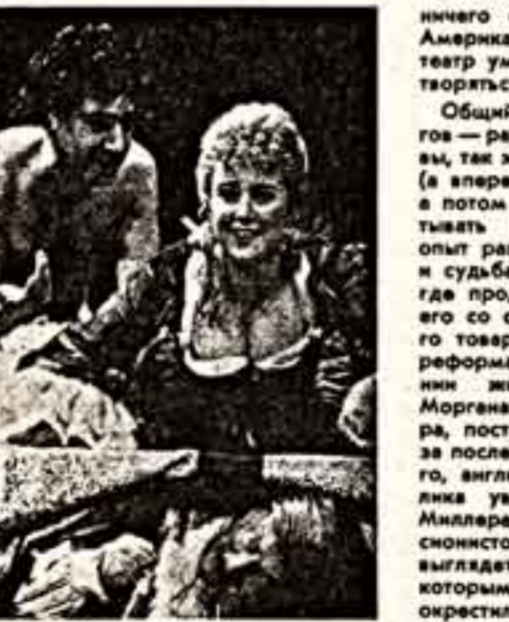
Смелая новая работа 76-летнего Артура Миллера — одна из величайших пьес, ожививших лондонскую театральную Мекку — Вест Энд.