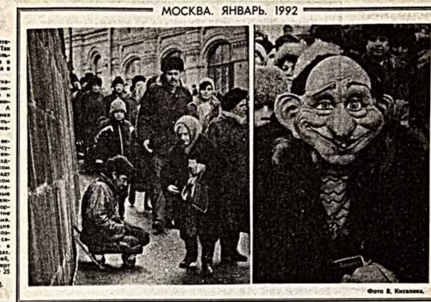
МОСКВА. ЯНВАРЬ. 1992

Мне, признаться, тоже кажется неординарным в магазине не подпадают. Мне тоже скучно.