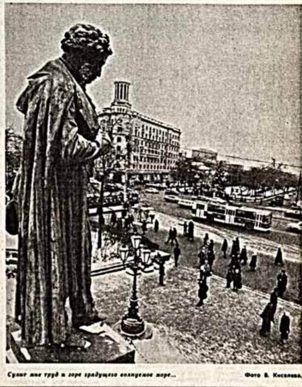
Судят лие труд и горе градоустроителя волжского жор...