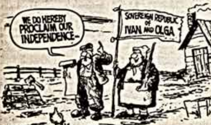
Материал подготовил Владислав БУРБУЛИС. (Корр. ТАСС — специально для «Культуры»).

Настоящая ли революция или просто переименование? Надпись на флаге: «Сверженная республика Иван и Ольга».