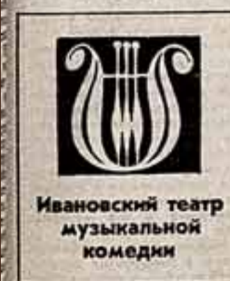
Ивановский театр музыкальной комедии

Должно быть, это непростое — заставить зрительный зал то бурно взрывается смехом, то замирает в раздумьи.