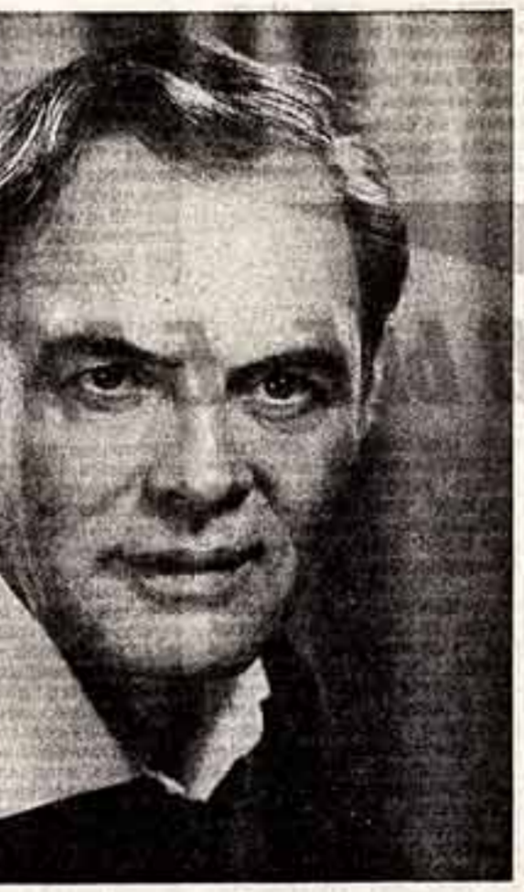
Павел Петрович Кадучников

Народный артист РСФСР, лауреат Государственных премий. Замечательный советский актер.