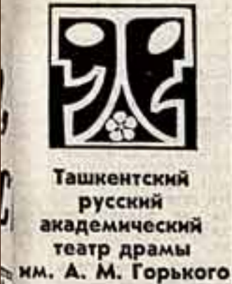
Ташкентский русский академический театр драмы им. А. М. Горького

Из восьми пьес, показанных в Москве, четыре принадлежат перу советских авторов. Классика представляют произведения Шекспира, Сухова-Кобылина и А. Н. Островского.