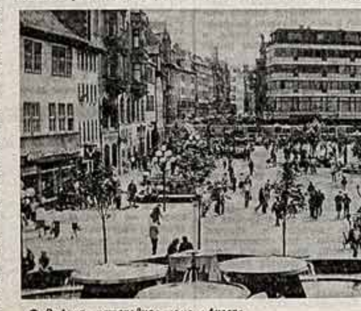
Эрфурт, пешеходная зона «Ангере»

работа проводится очень настойчиво и с неизменным успехом. Горожане любят улицы, где можно неспешно прогуляться, не опасаясь автомобилей, где много магазинов, где царит покой и уют, отсутствуют стремительные ритмы большого города. Разве забудете прогулку по Ангеру в Эрфурте, улицам Освободившейся в Дрездене и Клемента Готвальда в Потсдаме? Здесь новое в тактичном и добром соседстве со старинной, а издала дельта уличного убранства продумана: фонтаны, скульптурные и ландшафтные композиции, скамейки, витрины, арchedные тумбы, городские часы, реклама... И главное, тонкое соединение архитектурных эпох, стилей, мотивов. Достижения немецких гра-