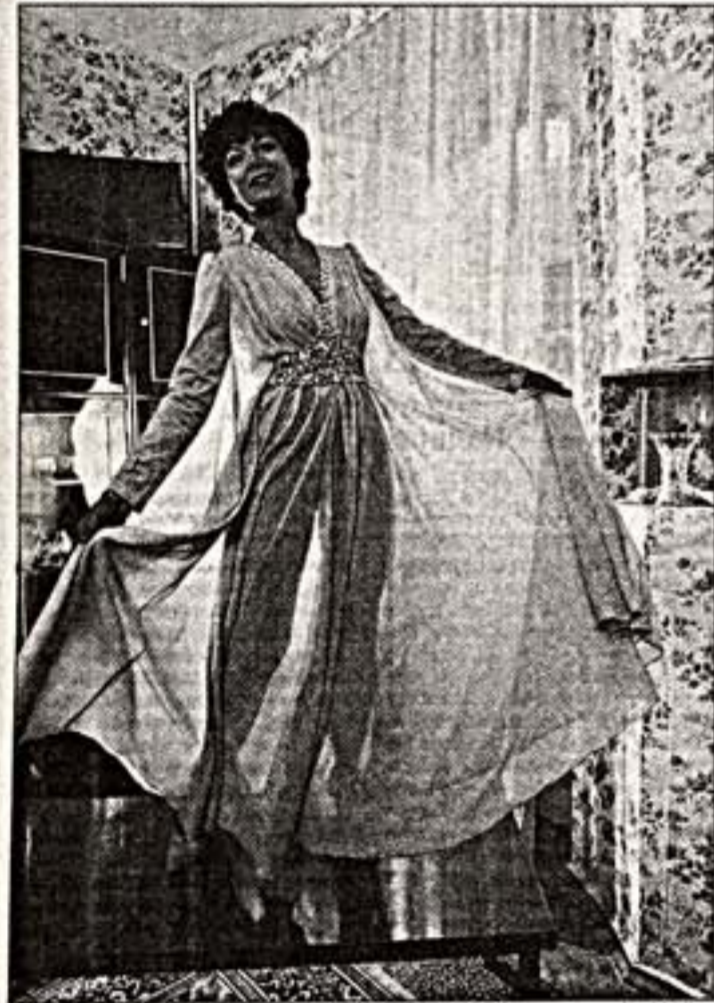
С. Борисов. "Дама в вечернем платье". 1982 г.