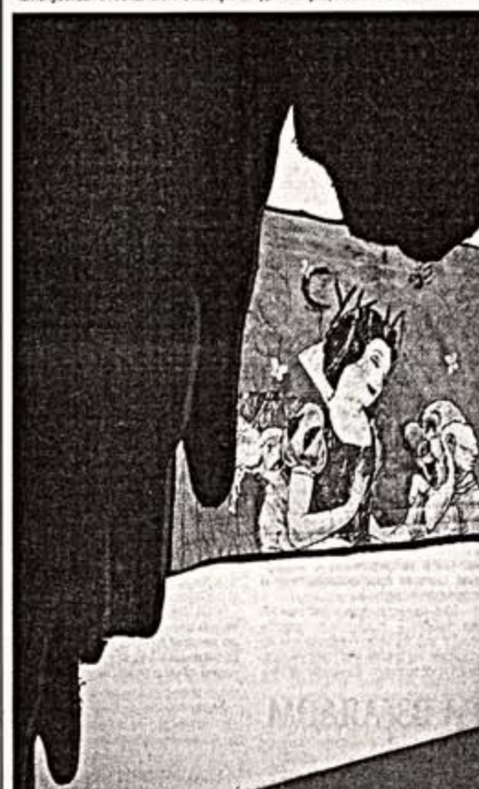
Слева: Г.Островерхова. "Австрийская история". Справа: Г.Литичевский. "Королев вальс". 2007 г.

Да и бог с ней, с реальностью. Федор РОМЕР