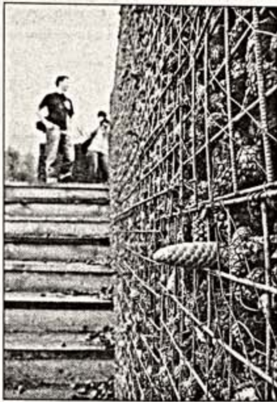
Если бы мы сказали, что после четырех часов дороги я буду бродить по незнакомому полю, то по крайней мере о полковой дороге под мелким дождем в поисках мимолетных и эфемерных арт-объектов, не чертова, и пролетания все на свете, а с некоторым даже энтузиазмом, и бы в жизни не поверил. Тем не менее это правда. В Никола-Ленивце, где второй год открывается фестиваль "Архстояние", много примеров к жизни.