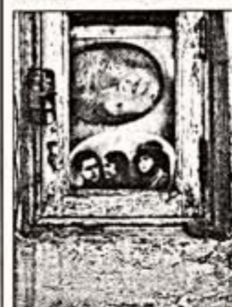
А. Забрина. "Прощай ли московским колумбариям". "Прощай ли московским колумбариям" — такой необычный проект представляет в ММСИ известный фотограф Александр Забрина. Скрыв-

ная по размерам экспозиция поражает не пластическими языками, а абсолютно нетрадиционным взглядом на жизнь и смерть человека. Фотообъектив запечатлел последний момент его существования — захоронения. Забрина давно привлекают прощания по кладбищам. Принадлежит к тому любящему прощанию — здесь обострено чувствительность, тягостность бытия. И в то же время прочувствованное величие чувством любви к жизни. Какие признания высказываются на могильных плитах. Близкие и друзья — каждый на свой лад — на надгробных плитах (а в колумбариях — это совсем небольшой кусок мрамора или бетона) хотят оставить память об ушедшем.