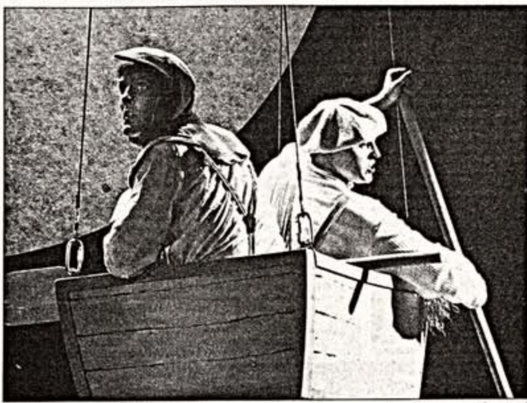
Сцены из спектаклей "Муми тролль и комета" (вверху) и "Золушка"