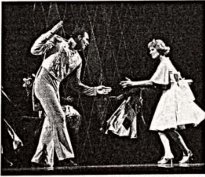
Сцены из спектаклей "Муми тролль и комета" (вверху) и "Золушка"