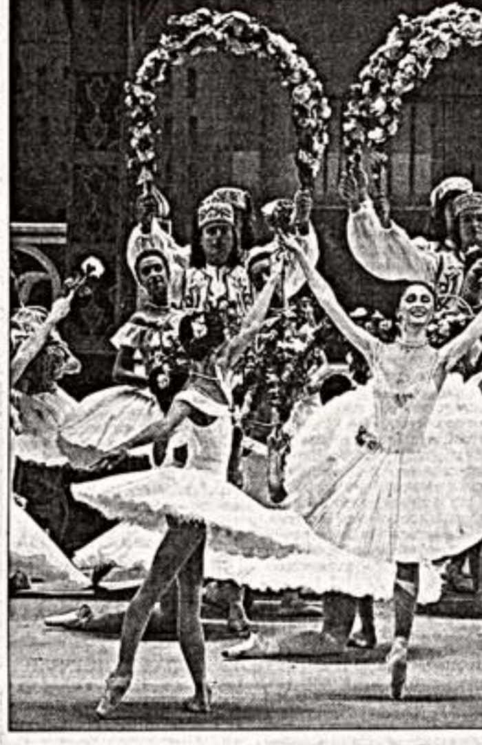
Сцена из спектакля "Корсар"