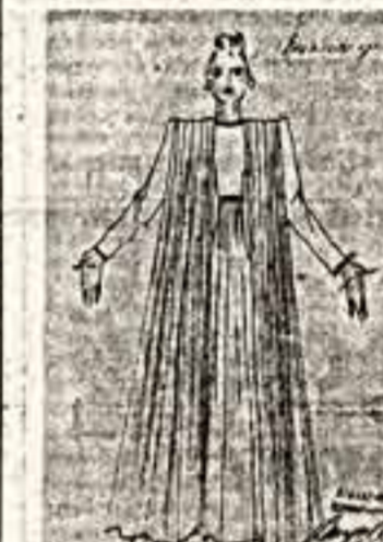
Один из многочисленных эскизов А. Шешунова: костюм для «Вивальди-оркестра».