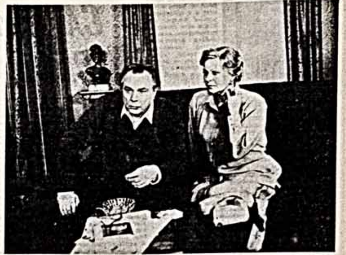
О новом фильме «Время сыновей»