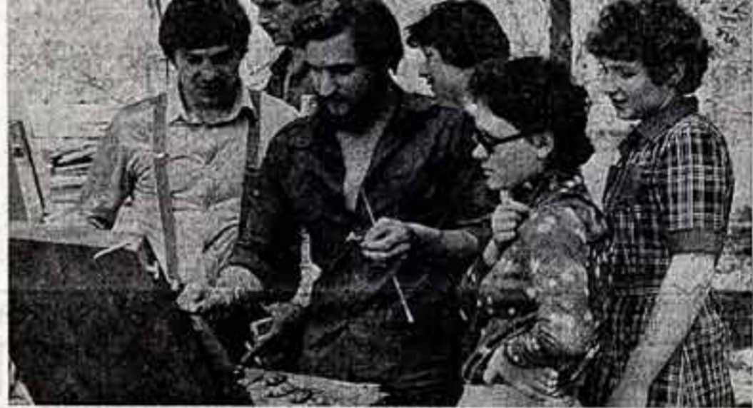
Обновление парка осуществляет центральное лесохозяйственное предприятие Всесоюзного объединения «Леспроект».

В музее сохранились планы парня, составленные в 1818—1829 годах. Они и легли в основу работы, которая ведется по проекту, созданному группой ландшафтных архитекторов под руководством В. Агальцова.