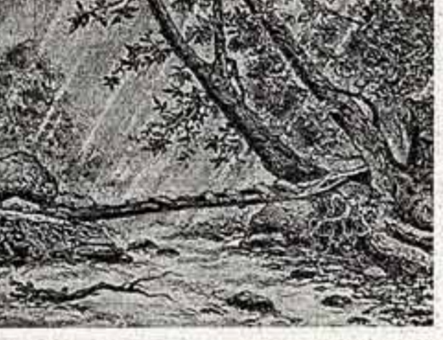
Горный ручей. Выжигание. Автор К. Агапов.