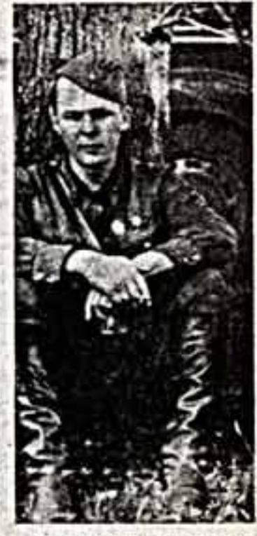
Александр Твардовский. 1941 год.