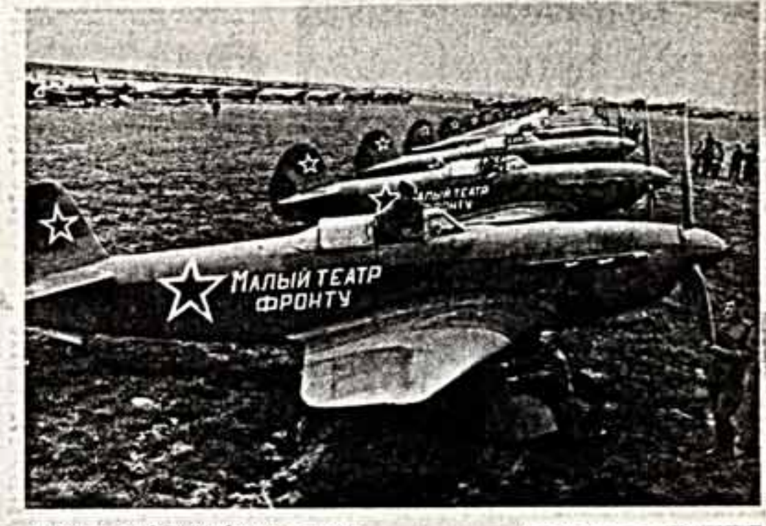
В день передачи эскадрильи летчиков.