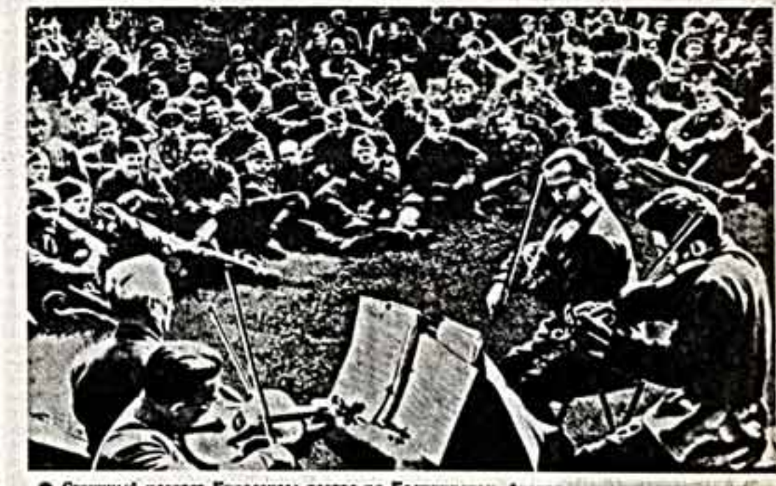
Струнный квартет Кировского театра на Калининском фронте.