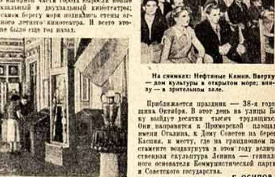
На снимках: Нефтяные Камни. Вверху — дом культуры в открытом море; внизу — в зрительном зале.

В близжайшее время на Ленинградском заводе «Союзмашинструмент» начнется отливка скульптур из бронзы.