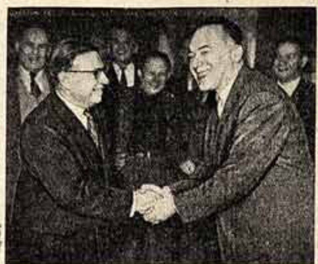
В Московском театре сатиры. Жан-Поль Сартр (слева) и режиссер В. Плукер.