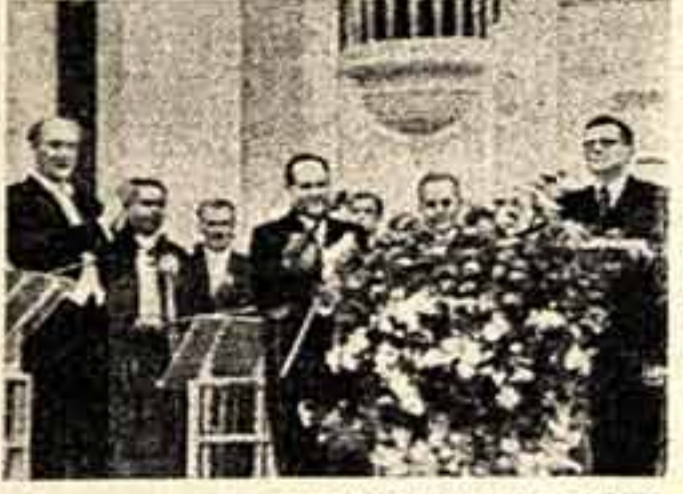
На снимках: на первом плане (слева направо) — Е. Мравинский, Д. Обстрах и Д. Шостакович.

Скрипичный концерт Д. Шостаковича во многом напоминает написанную композитором Десятую симфонию. Форма его основывается на контрастном сочетании резко контрастных образов. Да и драматургическая концепция концерта, характер и содержание его частей невольно вызывают аналогии с Десятой симфонией. Но здесь больше воздуха, теплоты, непосредственности радости. Выделяется композитор настойчиво стремится найти наиболее совершенное, наиболее острое и темное, но многообразное драматическое художественное образ.