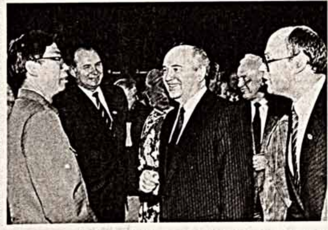
В актовом зале ВСНП М. С. Горбачев встретился с представителями китайской общественности.

Конечно, предстоит еще всесторонне обсудить тот широкий круг идей, различных точек зрения и предложений, которые возникли и выдвигались в ходе бесед. Но уже сейчас можно сказать: мы удовлетворены результатами переговоров.