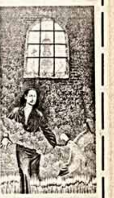
В. Балабанов. «Возвращение Паула Флоренского».

К Международному дню музея публикуем статью Паула Флоренского «Храмовое действо, как святое искусство» — о судьбе архитектурного комплекса Троице-Сергиевой лавры.