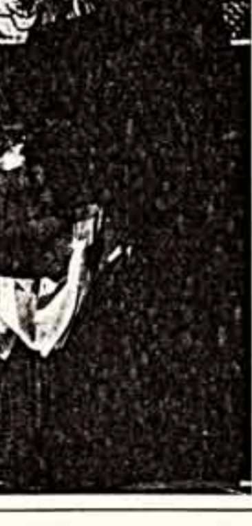
Сцены из спектакля «Калевалла» в жанре у Невольничья театра-студии «Человек».