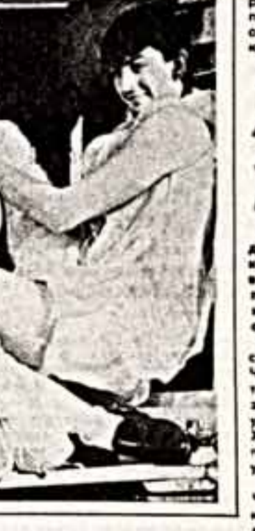
Сцены из спектакля «Калевалла» в жанре у Невольничья театра-студии «Человек».