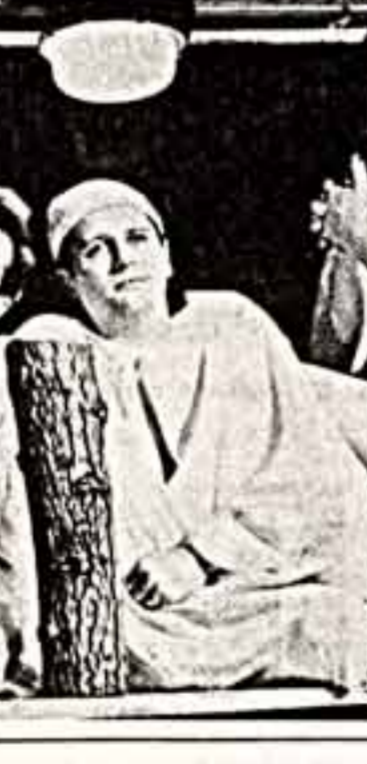
Сцены из спектакля «Калевалла» в жанре у Невольничья театра-студии «Человек».