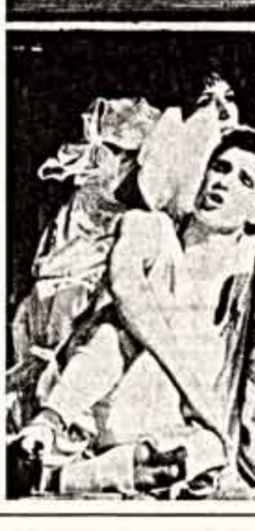
Сцены из спектакля «Калевалла» в жанре у Невольничья театра-студии «Человек».