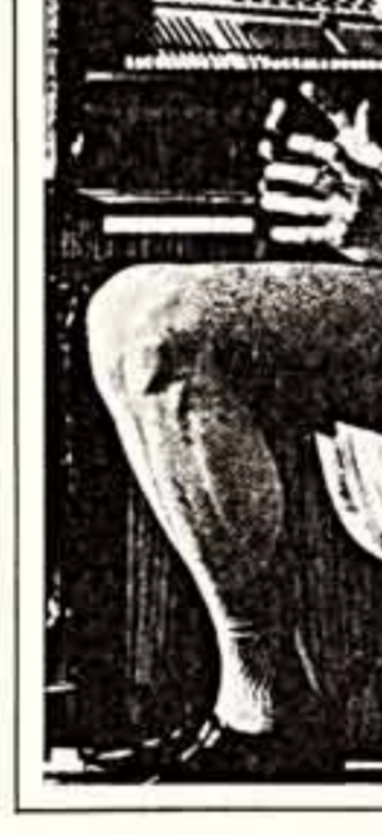
Сцены из спектакля «Калевалла» в жанре у Невольничья театра-студии «Человек».