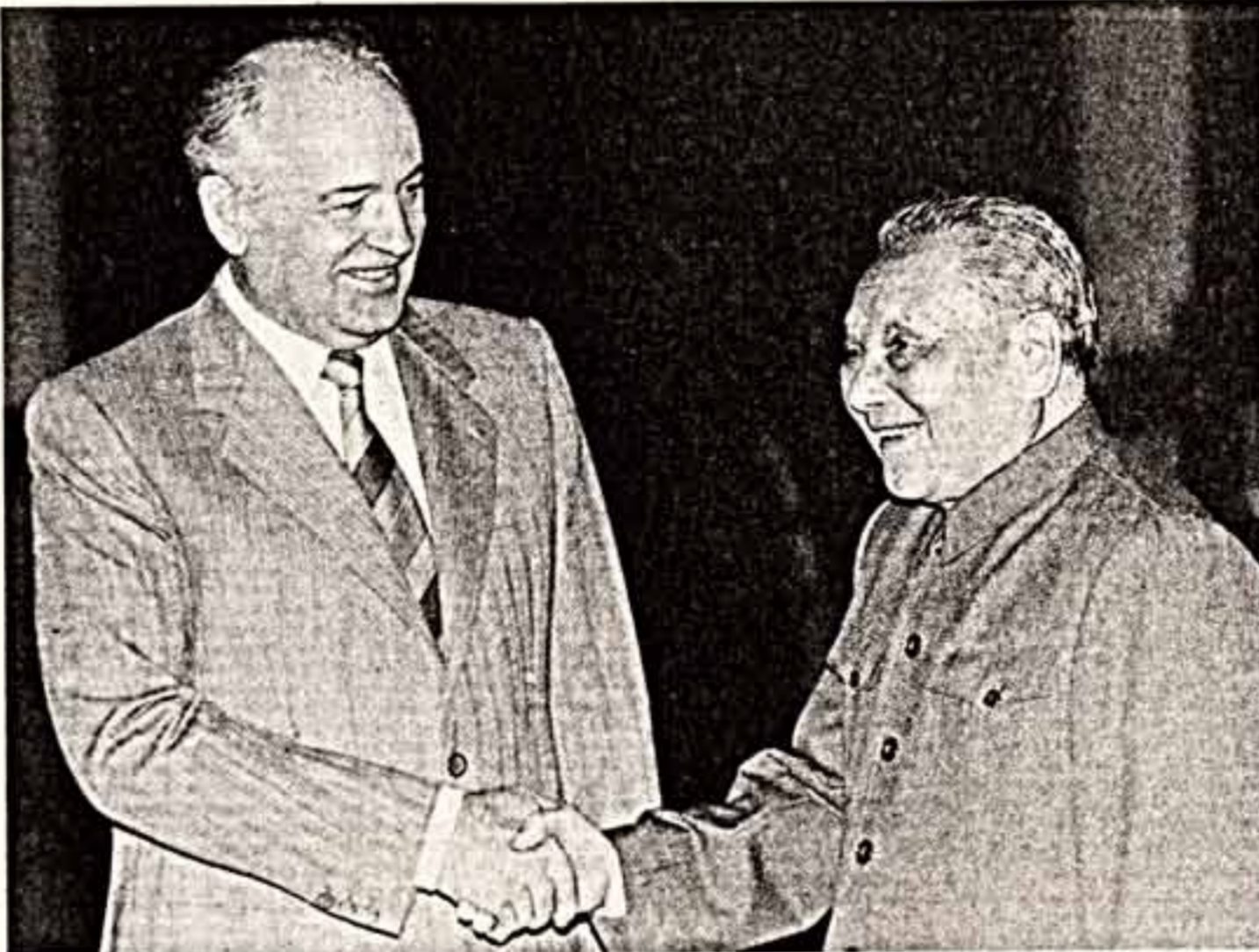
Встреча М. С. Горбачева с Дэн Сяопином.