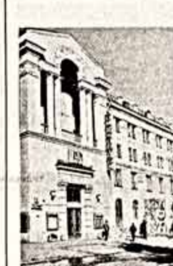
Дом культуры МЭН.