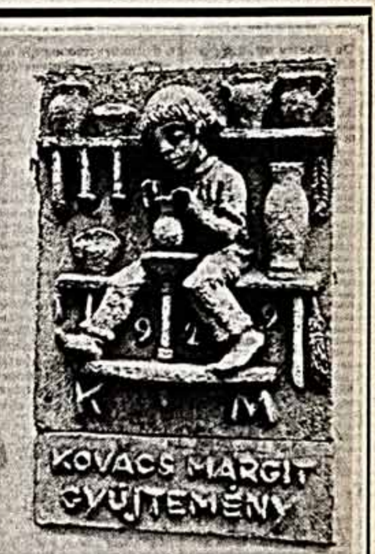
Керамическая выставка у входа в музей Маргит Ковач.

(Спец. корр. «Советской культуры»), СЕНТЭНДРА — БУДАПЕШТ.