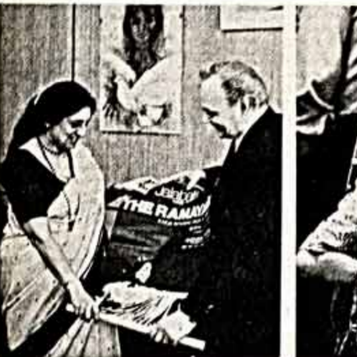
На днях в Москве, в Государственном музее Н. Островского, в рамках Фестиваля Индии в СССР состоялся вечер, посвященный 41-й годовщине установления дипломатических отношений между нашими странами.