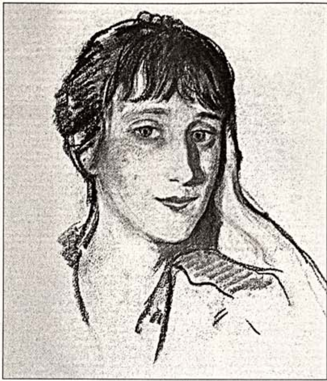
З.Серебрякова. "Портрет А.Ахматовой". 1922 г.