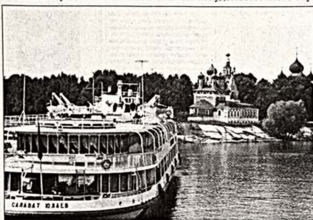
В скором времени храм Дмитрия на Крови может потеряться среди новобудов

В старинном русском купеческом Усадьбе вот-вот откроют комфортабельный отель класса-люкс с претензиями на звание "Волжской Ривьера".