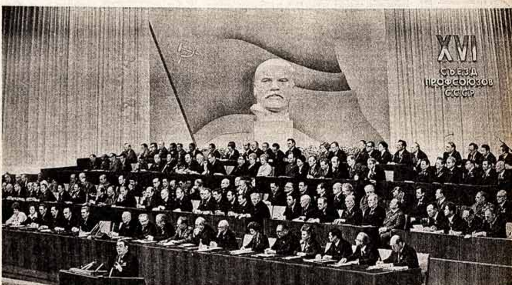
Москва. Кремлевский Дворец съездов. В президиуме XVI съезда профсоюзов СССР. На трибуне — Генеральный секретарь ЦК КПСС Л. И. Брежнев.

Да здравствует Советский Союз — родина Великого Октября! Да здравствует мир во всем мире! Да здравствует коммунизм!