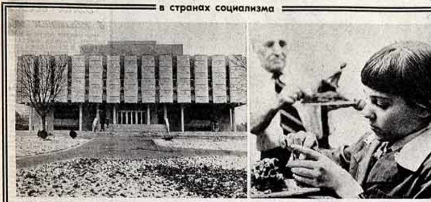
Венгрия. Культурный центр имени Шандора Хевеши открыт в областном городе Надьякхазе. В красивом здании современного облика разместилась выставка картин на 530 мест, выставочная галерея, помещения для занятий кружков.

● Обшире культурного центра. ● Один из кружков объединяет любителей искусства балета.