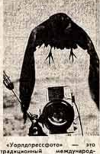
«Урлдрессфотом» — это традиционный международный конкурс журналистской фотографии.

фотографии. Итого его подаются ежегодно весной в столице Болондрии. Истерики. В творческом соревновании активно участвуют фоторепортеры социалистических стран.