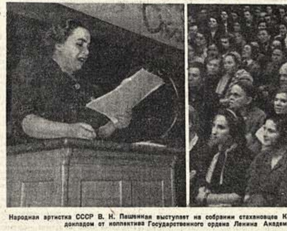
Народная артистка СССР В. Н. Пашенная выступает на собрании стахановцев Коминтерновского района г. Москвы с докладом от коллектива Государственного ордена Ленина Академического Малого театра.

На многолюдном собрании студентов, профессоров и преподавателей, служащих и рабочих Индустриального института в Новочеркасске горячо обсуждался вопрос о выдвигании кандидата в депутаты Совета Союза от Новочеркасского избирательного округа. Две тысячи пятьсот участников собрания постановили выдвинуть кандидатом в депутаты Совета Союза автора «Тихого Дона» и «Поднятой целины» — МИХАИЛА АЛЕКСАНДРОВИЧА ШОЛОХОВА.