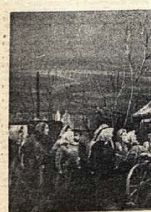
«Поднятая целина» в Большом театре. Сцена из 2-го акта

Сегодня, в день 15-летия, в театре идет спектакль «Сестрица Славя».