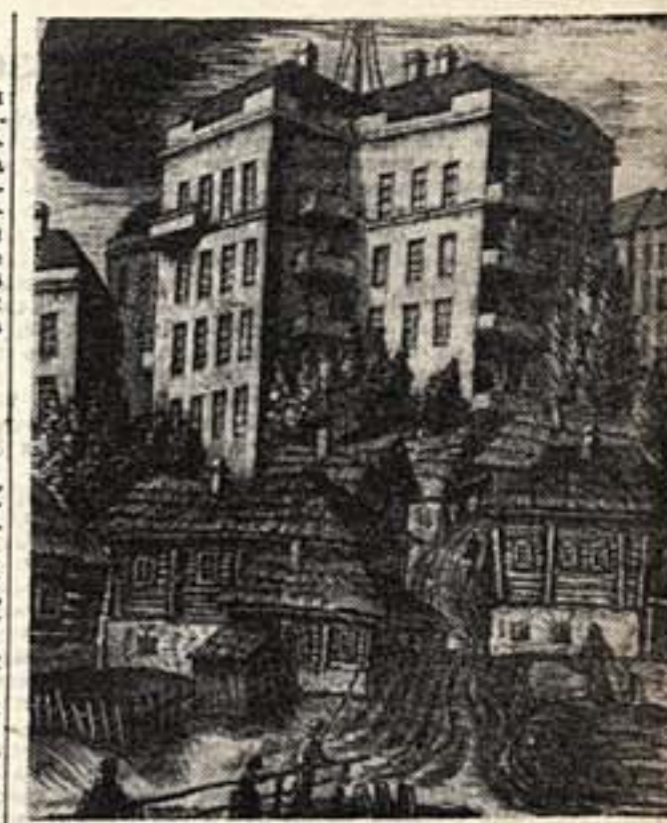
Худ. Юдовин. «Белоруссия». (Старое и новое). Выставка «Индустрия социализма»

Выделена специальная комиссия для проверки репертуара, подготовленного мастерской Мосэстрады к XX годовщине революции и в кампания по выборам в Верховный Совет СССР.