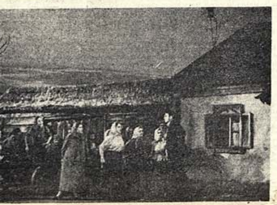
«Поднятая целина» в Большом театре. Сцена из 2-го акта