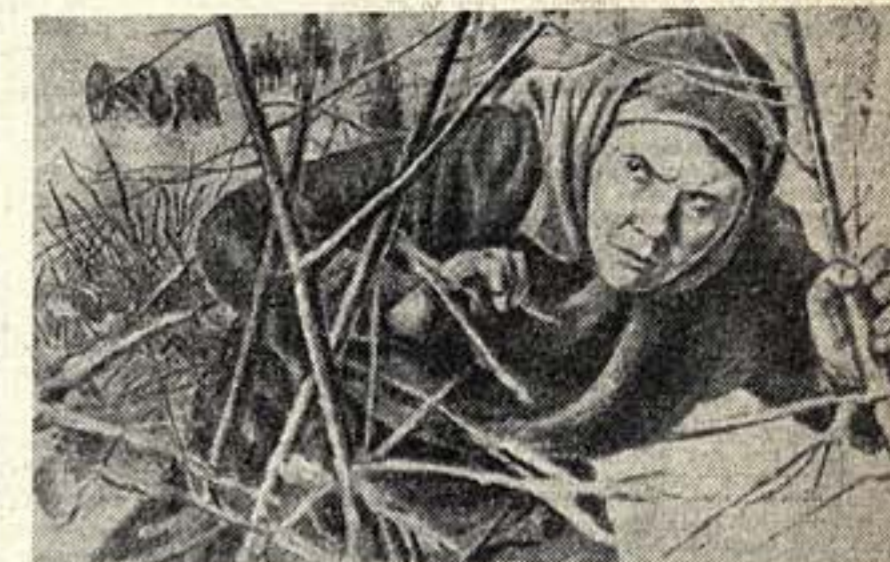
Выставка к 15-летию освобождения Дальнего Востока от белых и интервентов. Худ. Е. О. Машкевич. «Партизаны-разведчики»

В Хабаровске сейчас работает труппа артистов театра в составе 110 человек во главе с т. Поповым. 90 человек поехали дальше в Приморье с пьесой «Бойцы».