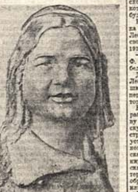
«Мамлять». Скульптура М. Рыдницкой

Концерт Гамбургера отличается простотой и ясностью музыкального языка.