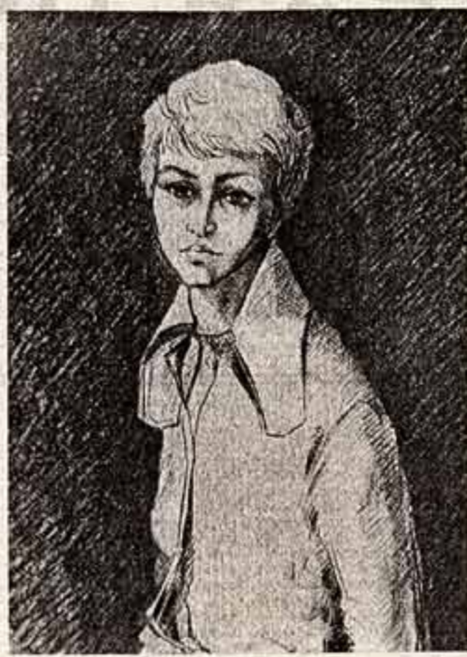
Э. Шенченко. «Таня и Сосны»