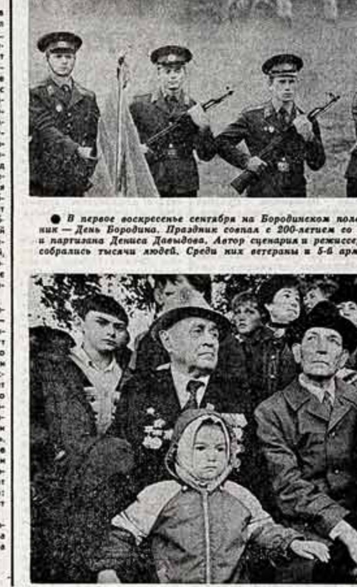
В первом воскресенья сентября на Бородинском поле состоялся традиционный праздник — День Бородины. Праздник совпал с 200-летием со дня рождения легендарного поэта и партизана Дениса Давыдова. Автор сценария и режиссер — Владимир Демин. На празднике собралось тысячи людей. Среди них ветераны и 5-й армии, освободившей Можайск.