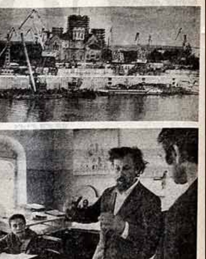
Горюхиные реставраторы приступили к восстановлению собора Александра Невского. Построенный в русско-византийском стиле в 1883 году, он являлся частью архитектурного ансамбля на Стреле и был одним из крупнейших строений того времени. В 1940 году собор сильно пострадал от пожара.

Работа с людьми всегда была для нашей партии первостепенным делом. Идея обретает реальную силу, если она опирается на массовый энтузиазм, на активное участие в общественной работе. Недавно в газете «Закарпатская правда» она написала: «Вера, которой я бессмысленно отдала свою