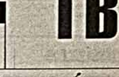
Рисунки В. СТИЛЛЕРА

ТВ-6 7.40 "Ветер в нава". 9.30 "Великие ценности мира". 10.00 "Назло рекордам!".