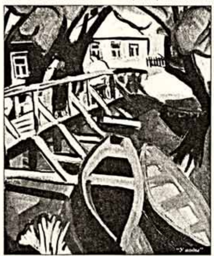
— У меня