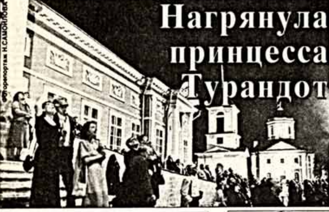
ШУМИМ, БРАТ, ШУМИМ