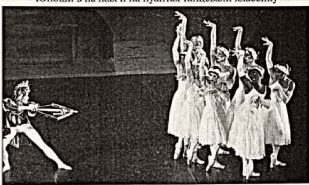
Сцена из спектакля "Лебединое озеро"

Юноши в пачках и на пунтах танцевали классику