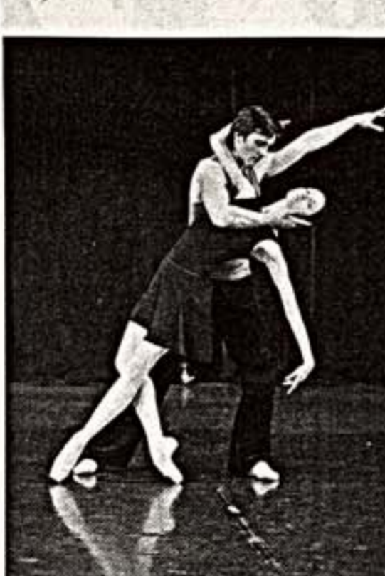
Фрагменты из спектаклей "Милосердие" (слева), "В комнате наверху" (в центре), "Серенада" (справа)