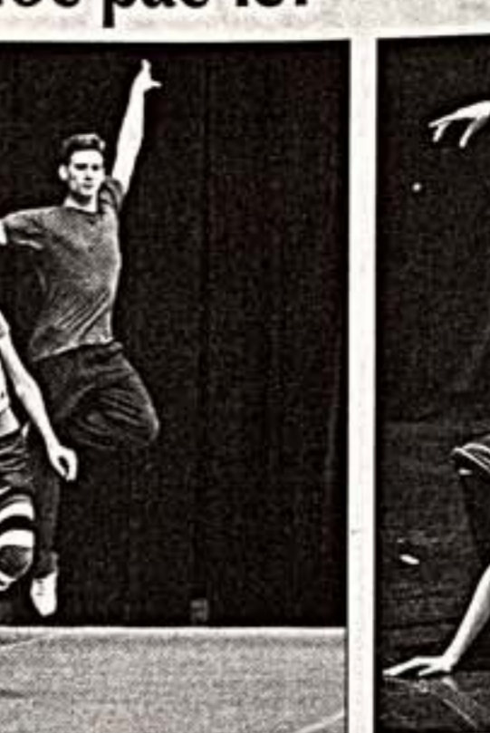
Фрагменты из спектаклей "Милосердие" (слева), "В комнате наверху" (в центре), "Серенада" (справа)

на, в противоположность математическим расчетам Тарп строится по интуиции. Прелюбленное танцевальное движение передает движения, струящиеся, как вода, и хореограф в предельных отрывах добивался от артистов "бессознательного" от одного па к другому, без фиксации. Он фантазирует на релаксацию, для каждого исполнителя находит особые движения, исходя не только из своих видений, но и из индивидуальности участников. Мы, к счастью, достигли той стадии, когда творчество и труппа относятся к постановке уже как к сосию" - отметил Кристофер Уилдон, соавременные для Николая Цискаридзе и Дем-