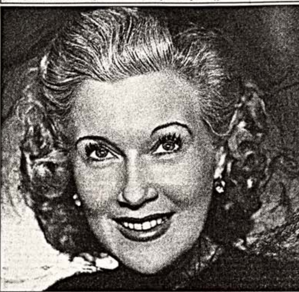
Л. Орлова. 1947 г.

11 февраля исполняется 105 лет со дня рождения Любови Орловой. Сегодня мы публикуем эссе театрального критика Марины Гавецкой.