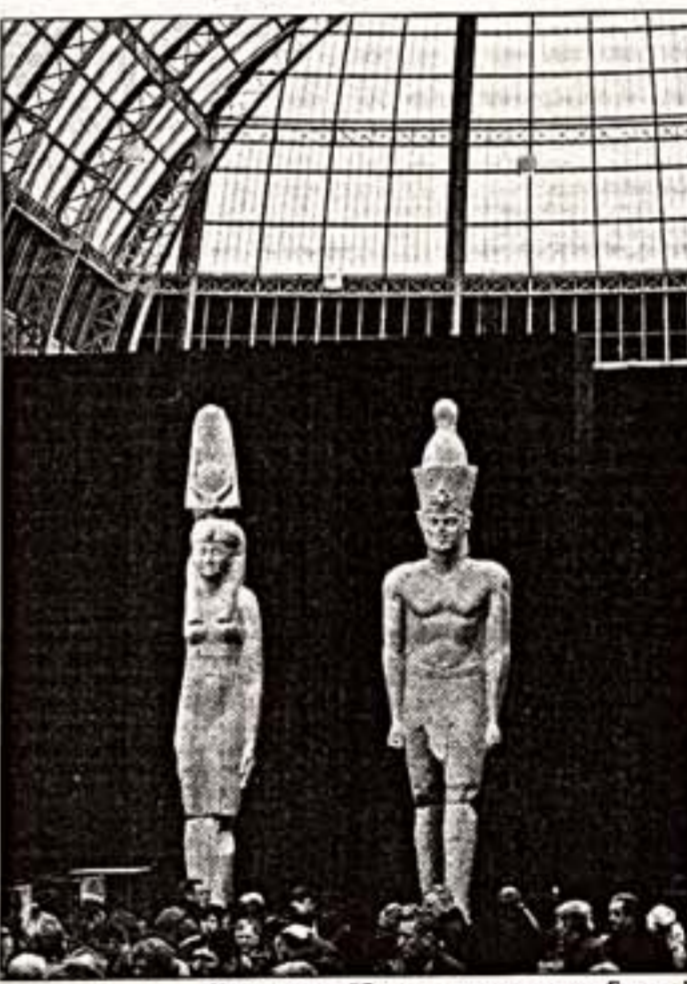
На выставке "Затонувшие сокровища Египта"