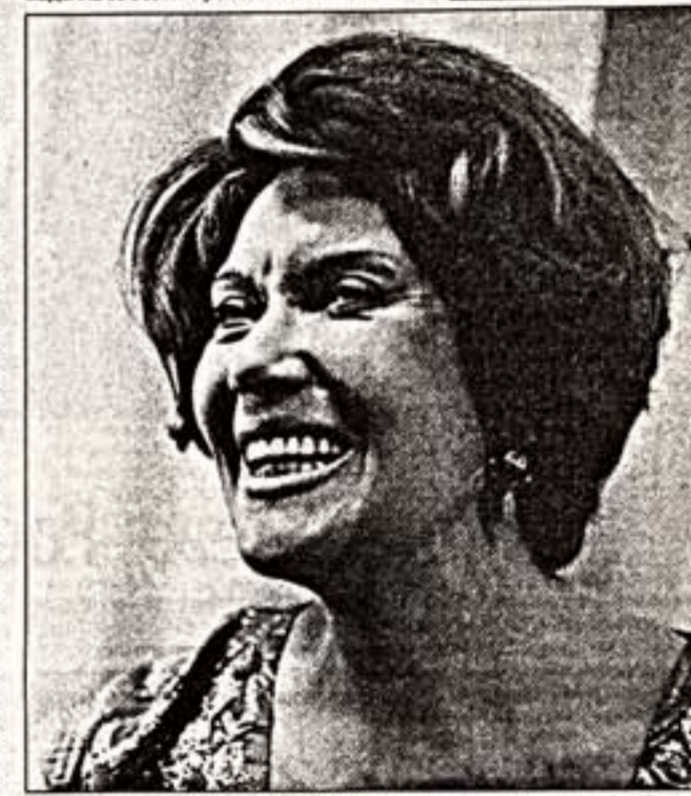
Л. Орлова на встрече со зрителем города Калинин в кинотеатре "Бульвар". 1971 г.