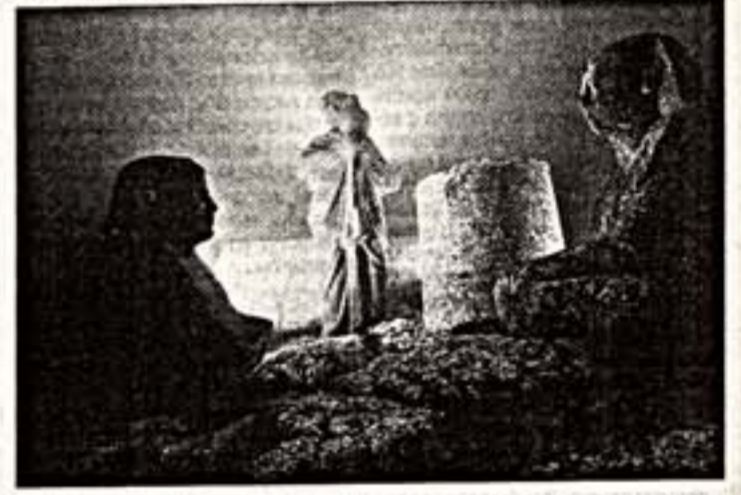
На выставке "Затонувшие сокровища Египта"