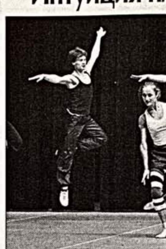
Фрагменты из спектаклей "Милосердие" (слева), "В комнате наверху" (в центре), "Серенада" (справа)

на, в противоположность математическим расчетам Тарп строится по интуиции. Прелюбленное танцевальное движение передает движения, струящиеся, как вода, и хореограф в предельных отрывах добивался от артистов "бессознательного" от одного па к другому, без фиксации. Он фантазирует на релаксацию, для каждого исполнителя находит особые движения, исходя не только из своих видений, но и из индивидуальности участников. Мы, к счастью, достигли той стадии, когда творчество и труппа относятся к постановке уже как к сосию" - отметил Кристофер Уилдон, соавременные для Николая Цискаридзе и Дем-