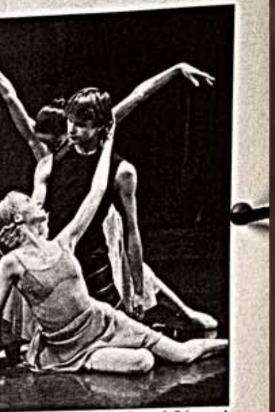
Фрагменты из спектаклей "Милосердие" (слева), "В комнате наверху" (в центре), "Серенада" (справа)

три Фидонова, на презентации не показали - они станут откровенными премьеры. Балет был поставлен в очень короткие сроки, но Уилдон доволен сотрудничеством с российской труппой. Впрочем, и Фрэнсис Раскол, и Кит Робертс тоже считают, что Балет Большого проявил гибкость, готов к постоянному новому и открытию для взаимных контактов. Впервые "Вечер американской хореографии" пройдет 13 февраля в рамках празднования 200-летия установления российско-американских дипломатических отношений.