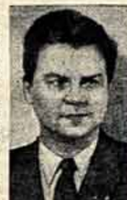
Т. Н. Хренников.

Будучи генеральным секретарем Союза советских композиторов, депутатом Верховного Совета РСФСР и членом Советского Комитета защиты мира, Т. Н. Хренников ведет большую общественную работу.