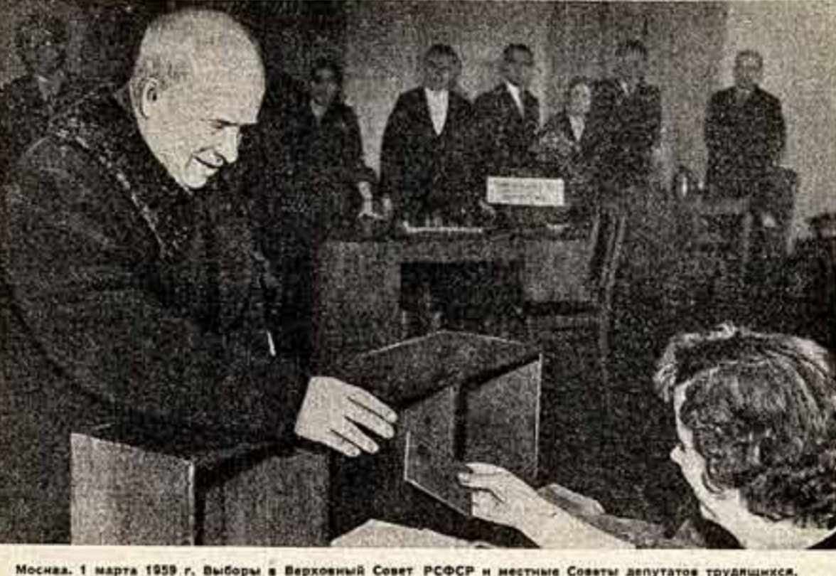
Москва, 1 марта 1959 г. Выборы в Верховный Совет РСФСР и местные Советы депутатов трудящихся. На снимке: на избирательном участке № 2 Краснопресненского района. Первый секретарь ЦК КПСС, Председатель Совета Министров СССР товарищ Н. С. Хрущев получает избирательные бюллетени.

№ 29 (898) Вторник, 3 марта 1959 года Цена 40 коп.