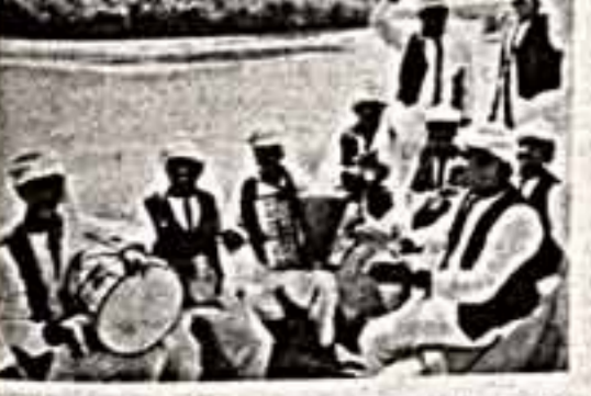
«Инобайхор» — так называется белгородский ансамбль из Мологского района Мухоморовского района (АСС).