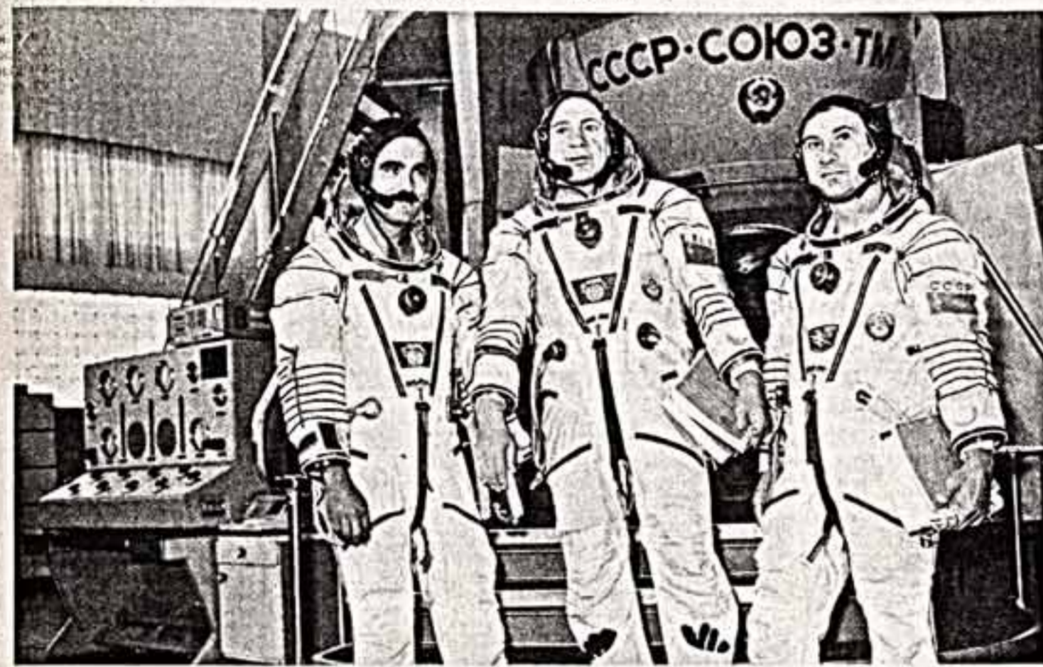
Командир экипажа летчик-космонавт СССР, дважды Герой Советского Союза В. А. Лавочкин (в центре), врач экипажа В. В. Поляков (справа) и гражданин Республики Афганистан космонавт-исследователь А. А. Моманд.

29 августа 1988 года в 8 часов 23 минуты московского времени в Советском Союзе произведен запуск космического корабля «Союз ТМ-8».