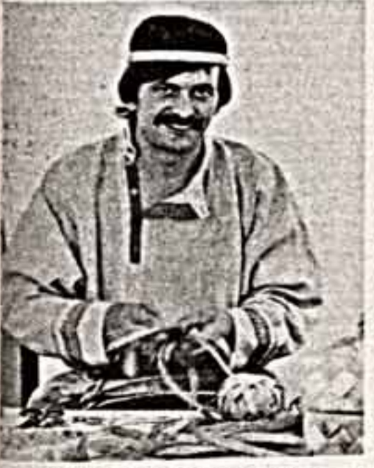
В Я. Мышенин работает булавочницей в ардан-Рассветном тресте «Сибирский алюминий». Он участвует в изготовлении планетона из березы.