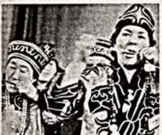
В зале Некрасовки, что на севере Саянских гор, выступление самодеятельных артистов — мальчик и пришедших к ним в гости артист из японского острова Хоккайдо.