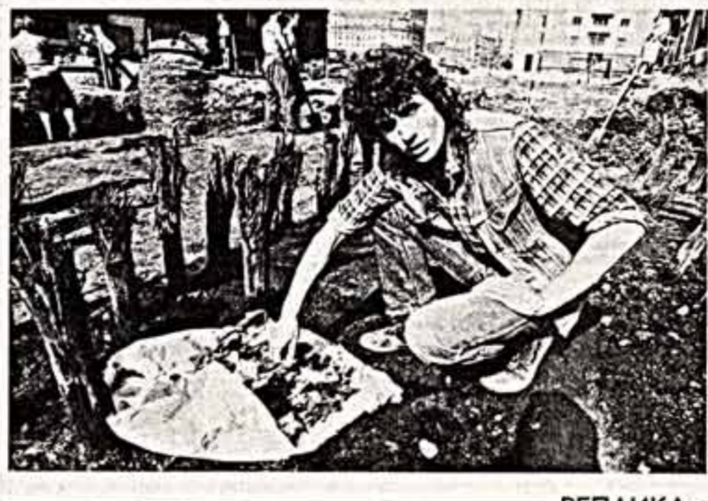
По плану первого этапа реконструкции центра Москвы будущая площадь Исторического проезда легла бы на металлическую основу. Когда строители начали отгружать котлован, то наткнулись на остатки деревянного сооружения. Это оказался погреб эпохи XIII века.

В. ИВАШКОВСКИЙ. (Наш соб. корр.) Иркутская область.