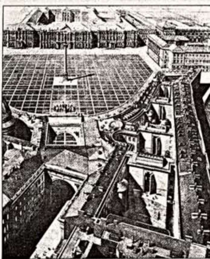
План реконструкции Павлова штаба Яеяин своей прелесть и в этикетках, которые были наложены до моего рождения, от руки тушью. В старых экспозициях обнаруживаются свои достоинства. Мы, например, приняли сначала шинель обновить древние чулочки

— И постоянная экспозиция в Замке дворца тема? — Ну конечно, открываем новые залы с современной подсветкой, новыми стилями и витринами, с “актуальным” дизайном. Но я вам скажу другое. Недавно к нам приехала женщина — одна из крупнейших специалистов по музейному искусству. И она сказала: “Какая потрясающая у вас экспозиция! Не сравнимо с с одними западными музеями, где дизайнеры уродуют искусство”. Я сначала поразила, а теперь понимаю, что есть