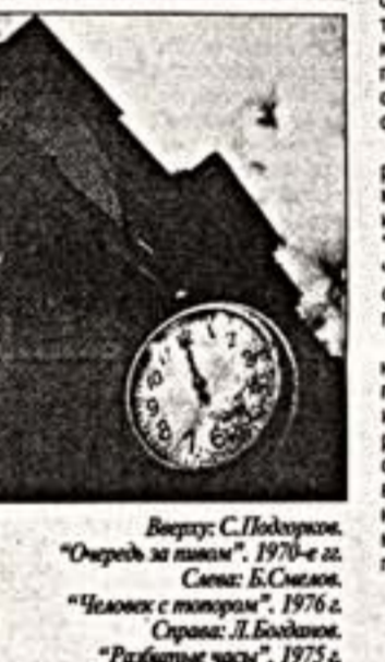
Витрина: С. Подгорный. “Очередь за пивом”, 1970-е гг. Снимок: Б. Смелов. “Человек с телевизором”, 1976 г. Снимок: Л. Бодякин. “Разбитые часы”, 1975 г.