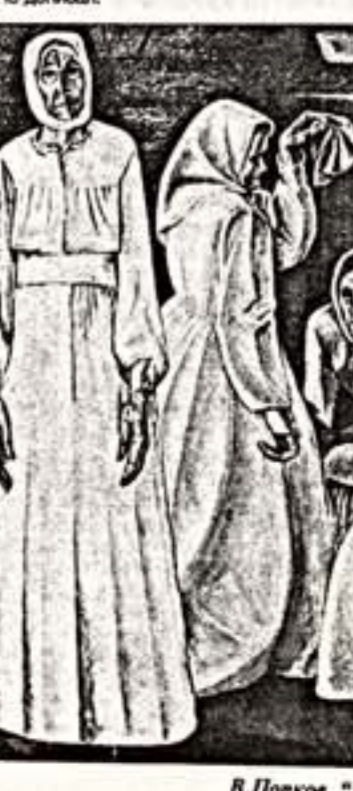
В. Попков. “Воспоминания. Воевы”. 1966 г.