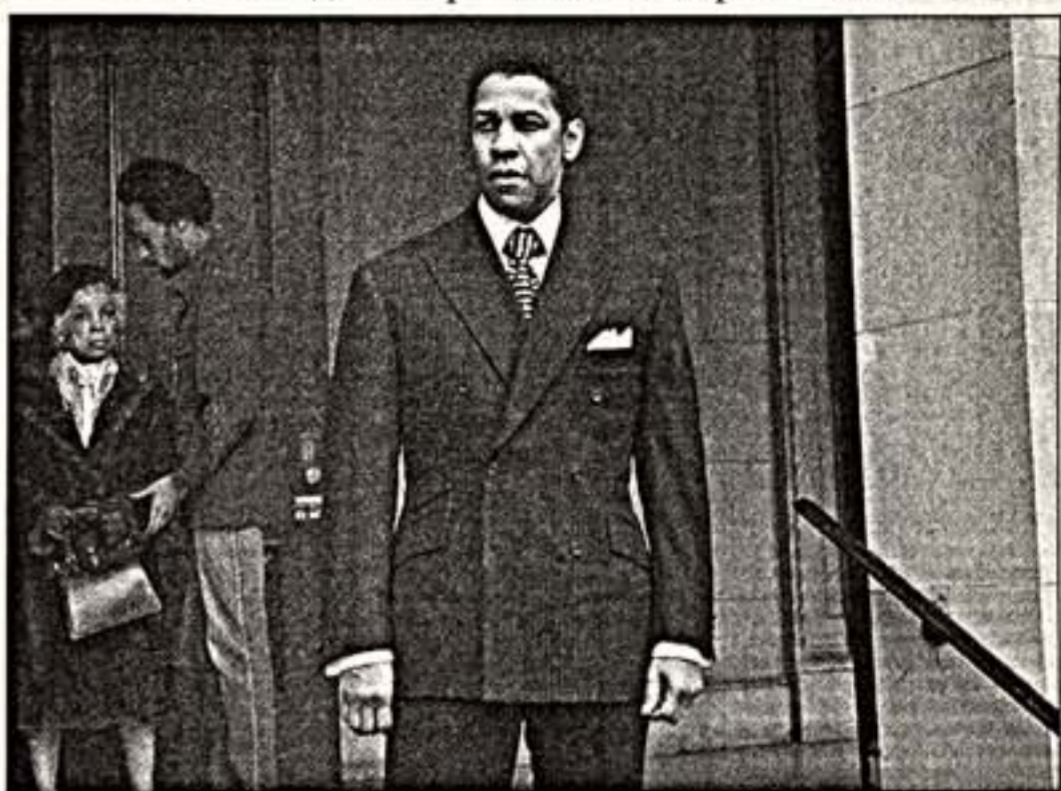
Кадр из фильма "Тангстер"

"Тангстер" Ридли Скотта и "Господин Неприкасаемый" Марка Левина