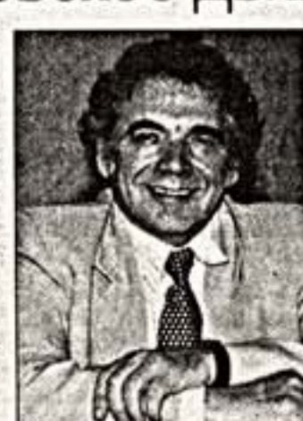
З.Брон — 60

17 декабря исполнилось 60 лет всемирно известному педагогу, замечательному организатору, прообразу музыканту Захару Брону.