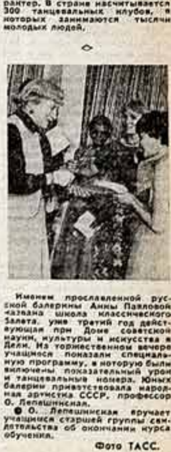
Именинница провозглашенной русской балерины Анны Павловой...