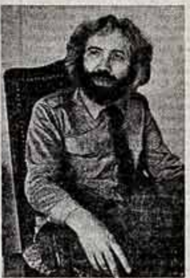
Собрать огонь мировых страстей на одну жаровню...