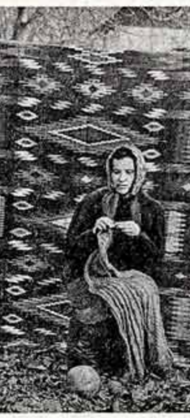
Ремесло в гонимых семьях забрана переберется от поколения к поколению. И сейчас еще деревенский ткацкий станок или инструмент для рыбной ловли можно встретить в сельском доме.

Р. БАРХУДАРОВ, директор театра № 5, член партийного бюро, БАКУ.