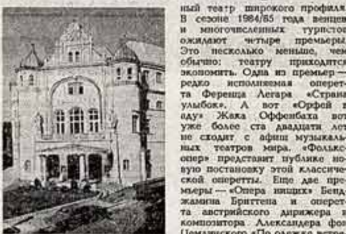
С жанровым и историческим искусством венской «Фольксопера» советские зрители впервые познакомились в прошлом году...