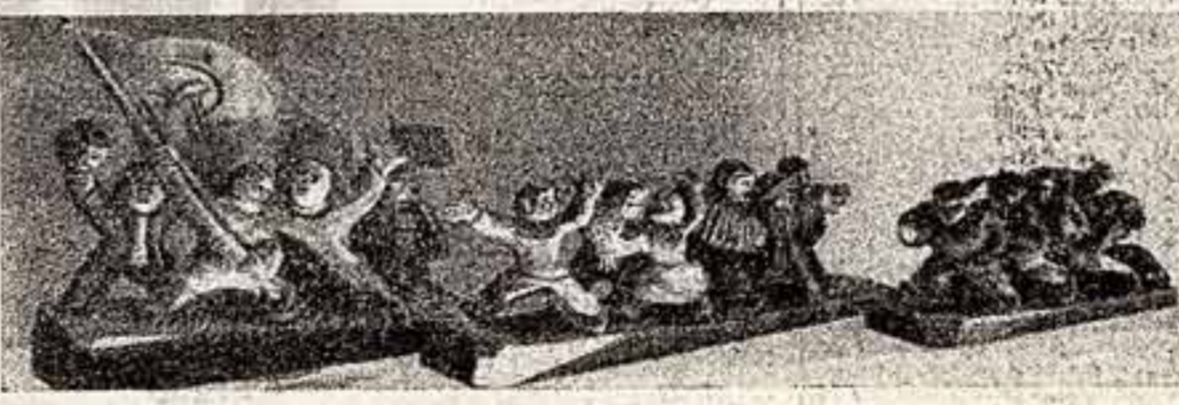
М. Лауринкус (Литовская ССР). «Праздник. Деревья».