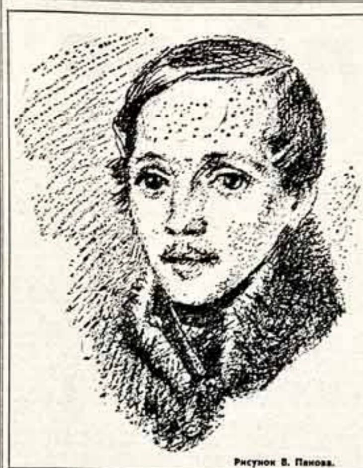
Рисун В. Павлова.

В старших цехах. Холостяки нового кинотеатра «Спутник» и слушатели областной фабрики города Новокузнецка. К их услугам зрительный зал на 450 мест, спортивный зал, где в десяти секциях и