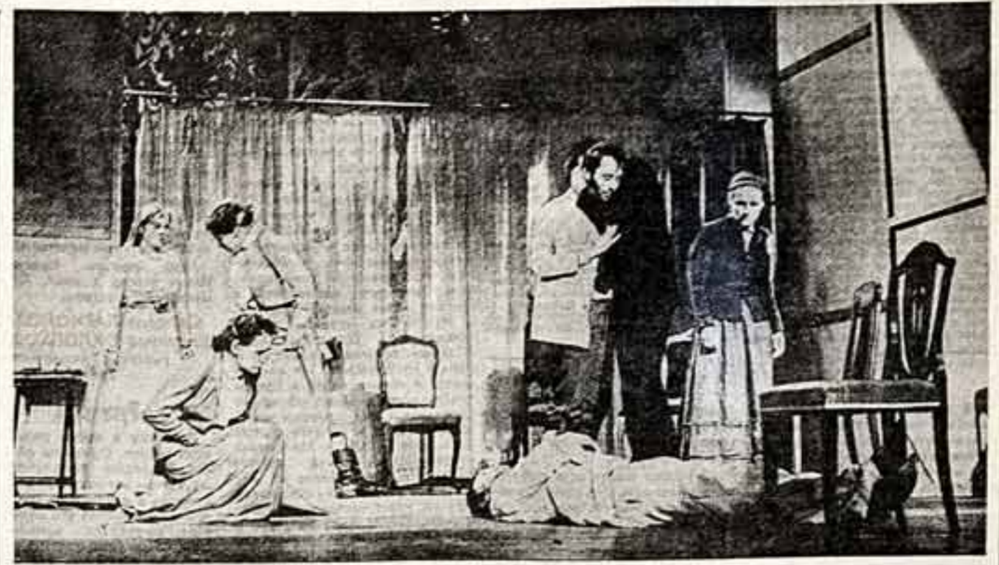
Вчера в коллекции филармонии МХАТ СССР имени М. Горького в Москве начал пока спектакль Драматического театра имени Максима Горького из Берлина.

С. РАЗГОНОВ, ПИЛУТРИККО, «Портрет мальчика».