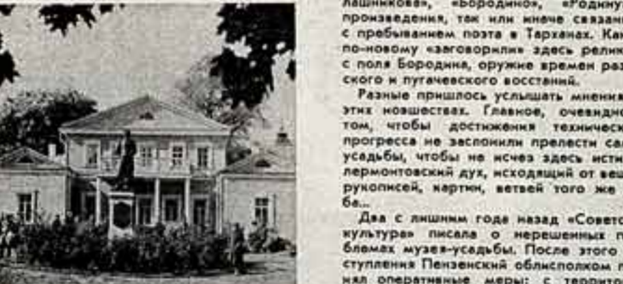
Дом бабушки поэта, в котором прошло детство М. Ю. Лермонтова. Интерьер дома Е. А. Арсеневой.