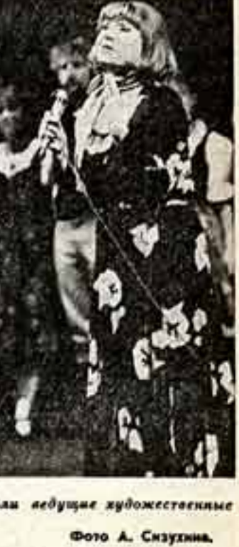
На торжественном открытии Дней культуры ГДР. В Большом театре Союза ССР выступают ведущие художественные коллективы братской страны и известные исполнители. ● Петер Шрайбер. ● Государственный ансамбль танца ГДР. ● Гизела Май.