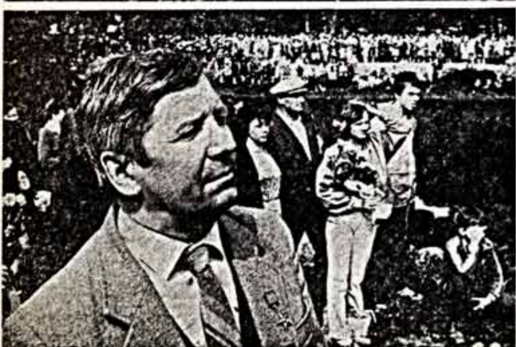
Любовь нашего народа и А. С. Пушкину, и его творчеству неизменно и вечна.