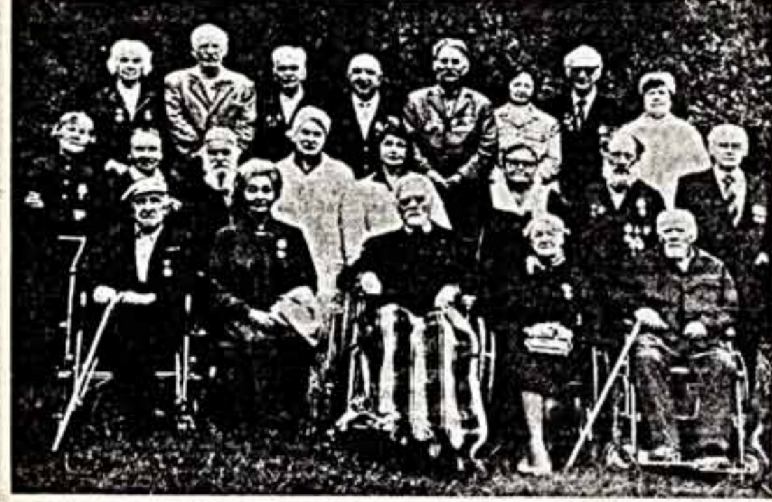
Кадр из фильма «Прощание славянки».