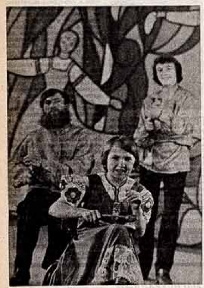
Горьковская область. «Колхоз имени Ленина Больше-Мурашкинского района в кадрах не нуждается» — так отвечает правление на письма, которые приходят из разных концов страны с предложениями от людей разных профессий.

Результаты этой работы среди населения непростое определить сразу. Но влияние ее становится все заметнее. В. ТЕЙВАНС, секретарь Московского райкома Компартии Латвии.