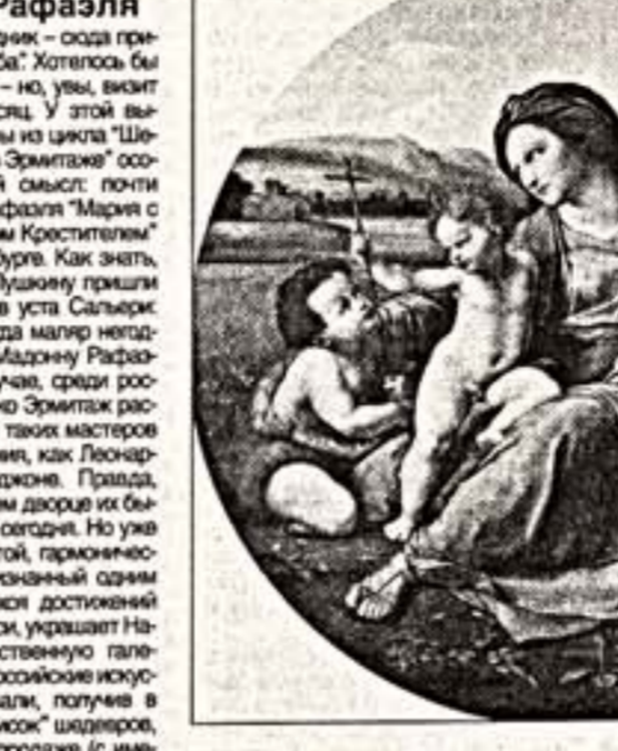
Рафаэль. “Мадонна Лежащая”

Мадонна Лежащая – одна из самых известных картин Рафаэля. Это картина, написанная в 1505 году.