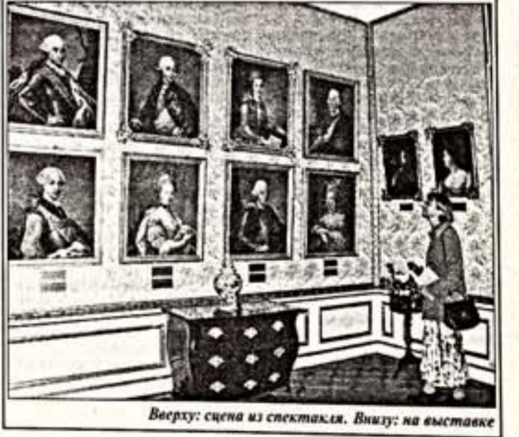
Беседу вела Татьяна ДАВЫДОВА

Возврат, развивать музыку уже некуда и нечем. Поэтому каждый музыкант придумывает оригинальные формы существования в музыкальном пространстве. Так можно, можно не переключаясь, никуда не стремясь, тем не менее находить способы музыкального самовыражения?