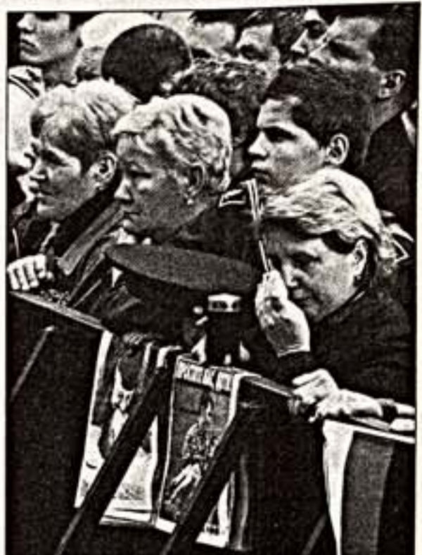
Москва. Васильевский спуск. 7 сентября 2004 г.

7 сентября, на второй день общенационального траура, на Васильевском спуске у Кремлевских стен прошел антитеррористический митинг "Россия против террора". По скромным подсчетам, в нем участвовало около 30 тысяч человек.