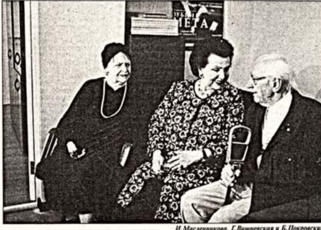
И.Масленникова, Г.Вишневская и Б.Покровский