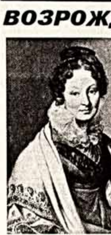
В 1976 году, разбирая содержимое старого сарая, главный хранитель Тамбовского краеведческого музея обнаружил портреты...