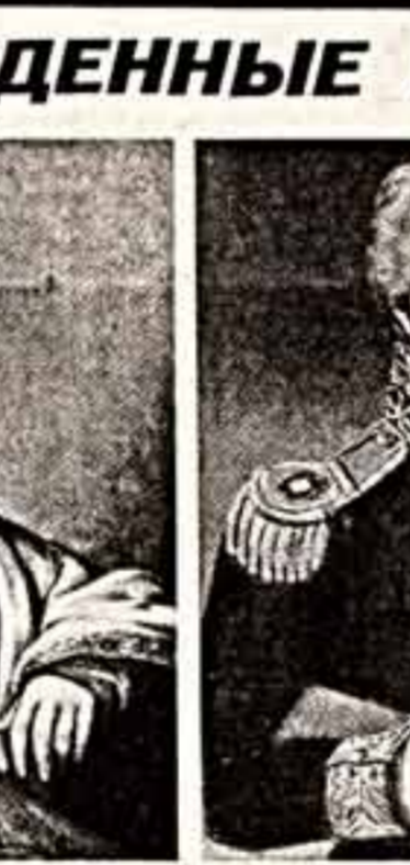
В 1976 году, разбирая содержимое старого сарая, главный хранитель Тамбовского краеведческого музея обнаружил портреты...