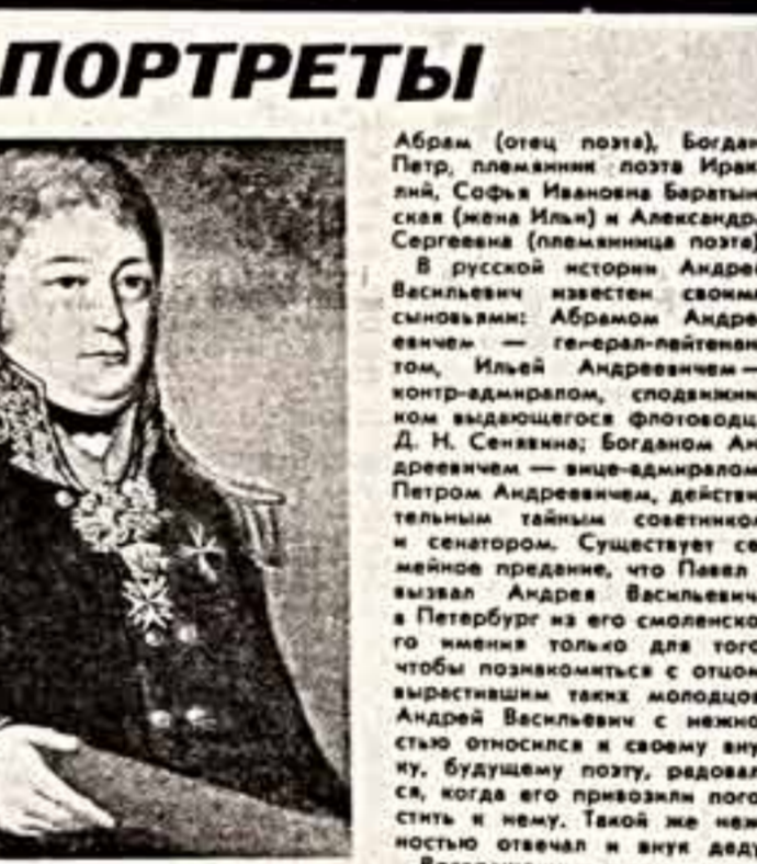
В 1976 году, разбирая содержимое старого сарая, главный хранитель Тамбовского краеведческого музея обнаружил портреты...

Преступления, о которых пойдет речь ниже, совершены в Киевской, Черниговской и Кировоградской областях.