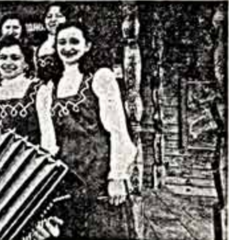
Аспиранты готовят