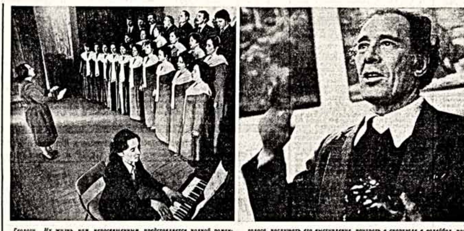
Геологи... Их жизнь нацелена на освоение целины, представляет собой романтику, поиски, завоевание новых рубежей. Но это лишь на первый взгляд. Сами же геологи хорошо знают о тех лишениях, которые преподносит им «целинная» работа. Может быть, поэтому так любят они свой город Мухомовск, любят вернуться из экспедиции в благоустроенные квартиры, походить в библиотеку, содейную собственными руками, попеть в хоре или, если нет