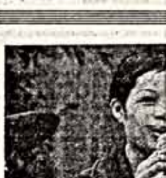
Музей естественной истории — это традиционное место проведения художественных выставок.