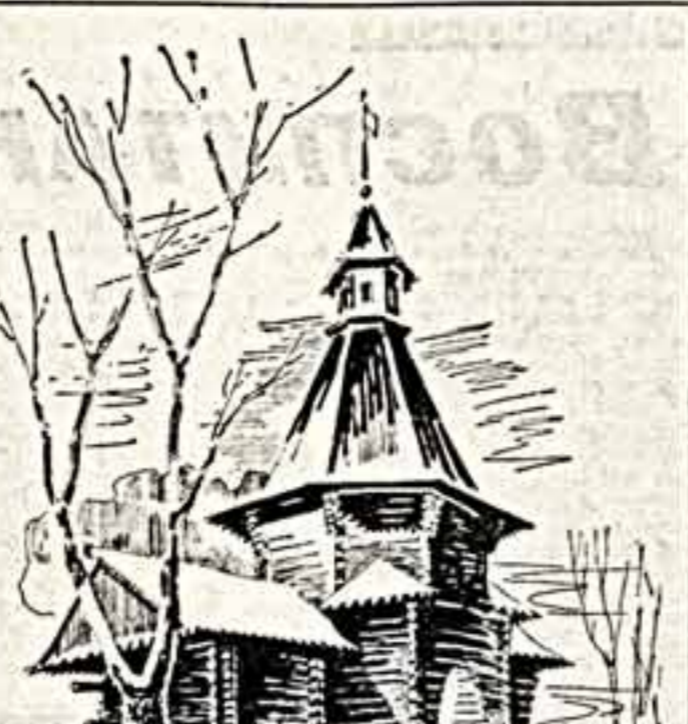
Знаменитый парк старинных построек привлекает сюда многочисленных посетителей. Особенно многолюдно здесь в эти весенние дни. На диком и полюбившемся чудесном уголке Москвы и сейчас эти зарисовки.