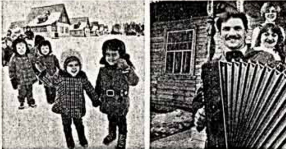
Колхоз имени М. И. Калинина Киржачского района Владимирской области — хозяйство крепкое и рентабельное. По итогам Всесоюзного социалистического соревнования колхоз награжден переходящим Красным знаменем ЦК КПСС...