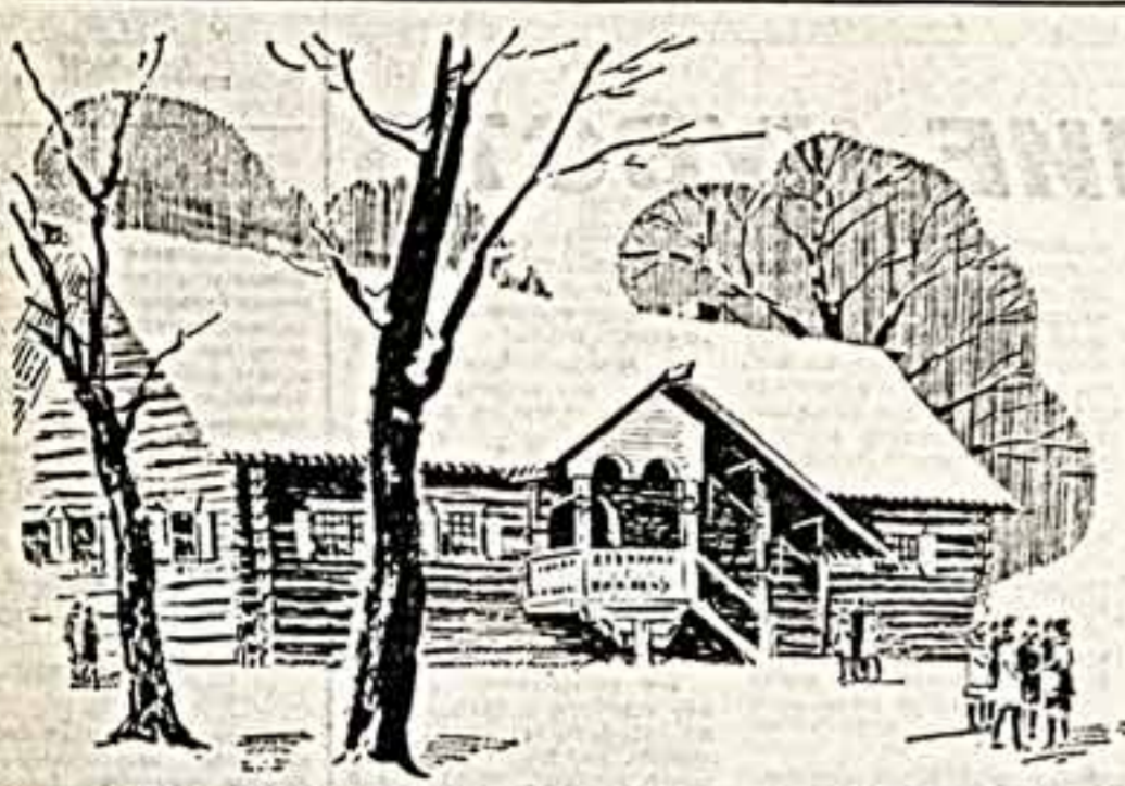
На крутом берегу Мессам-района красочно располосился музей-усадьба «Коломенское». В 20-е годы здесь был организован первый в нашей стране историко-архитектурный музей под открытым небом. Сюда привезли дома Петра I из Архангельска, проводные ворота Империала-Кареельского монастыря, другие постройки. Проездная баня, построенная на берегу Белого моря, представляет собой образец деревянных