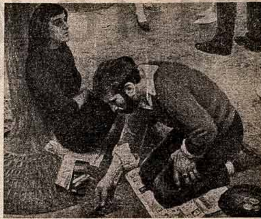
«ХУДОЖНИК» ГЕЛИЯ КОРЖЕВА

С 1953 года создано пятнадцать фильмов, поставленных советскими кинематографистами совместно с кинематографистами Болгарии, ГДР, Индии, Китая, Румынии, Сомали, Франции, Чехословакии, Югославии и других стран.