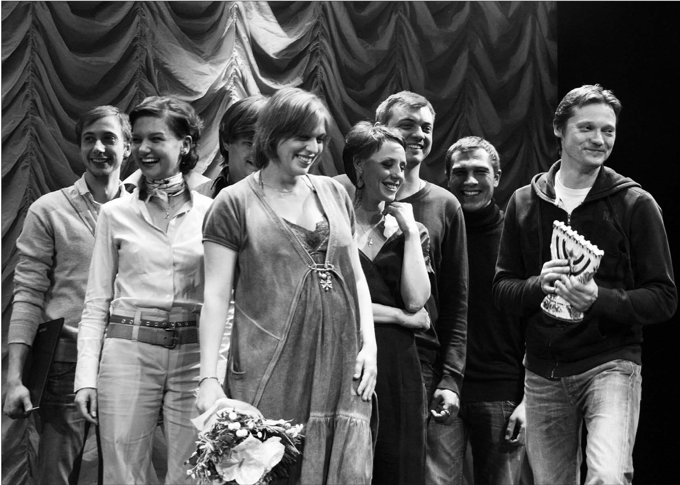
Один из “гвоздей” получили участники спектакля РАМТа “Ничья длится мгновение”

Вручена Московская театральная премия “Гвоздь сезона”