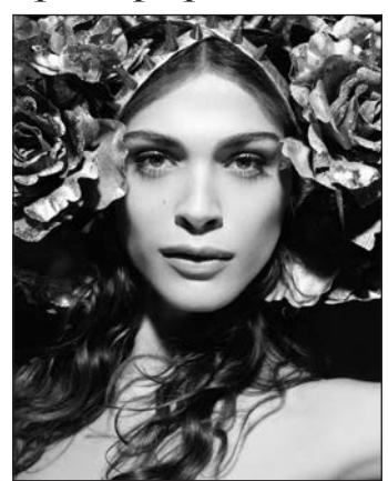
К.Лагерфельд. Для “Календаря Пирелли-2011”