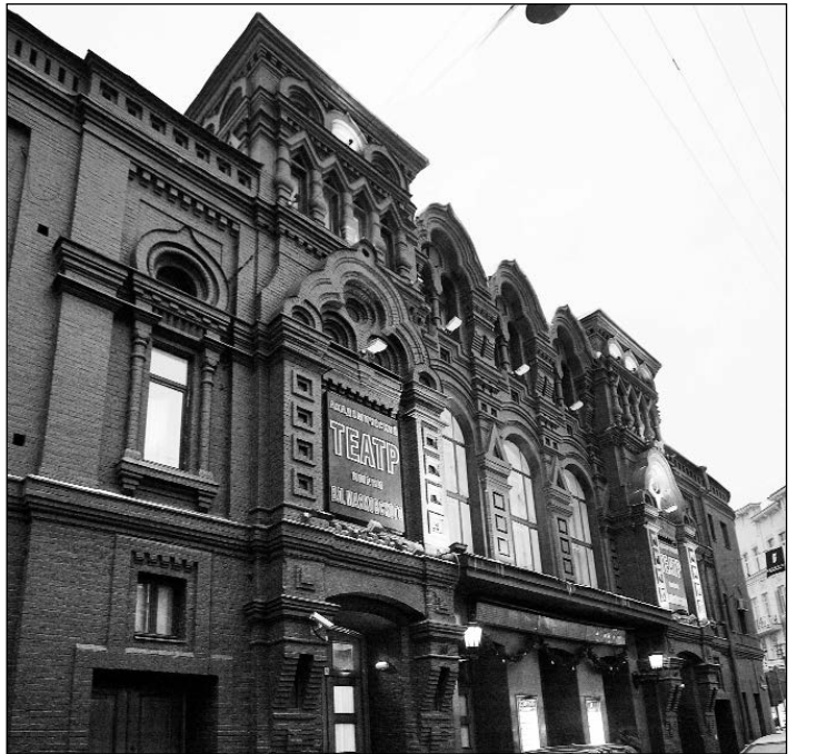
Театр имени Вл. Маяковского

Маяковка бунтует против своего художественного руководителя