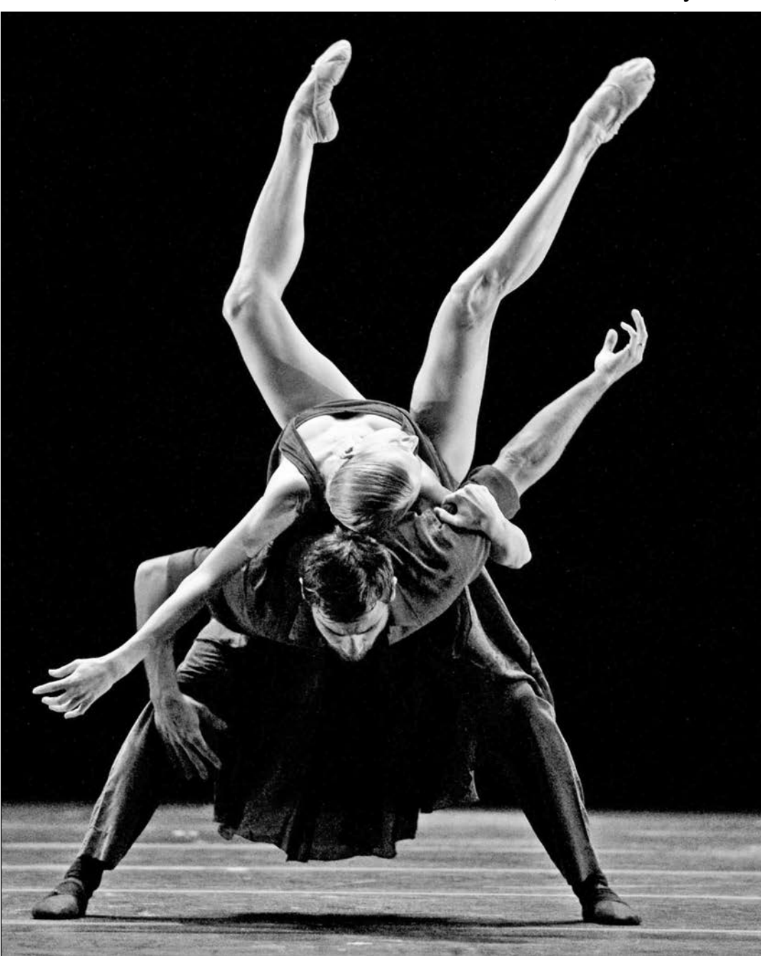
Сцена из спектакля "White darkness"

Унижения. В безумных пластических историях никто не слышит: дама свисает с рук кавалера, как макароны.