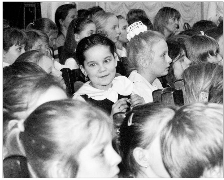
Получат ли дети творческое образование?