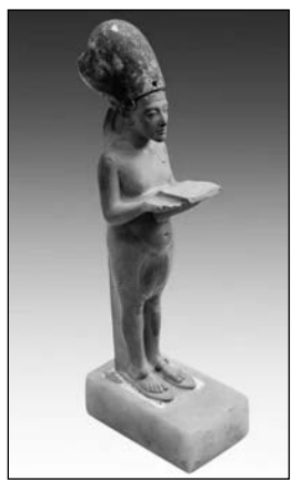
Статуя фараона XVIII династии Тутанхамона (1336 - 1327 годы до нашей эры), на одной из которых правитель запечатлен с гарпуном, а на другой его несет богиня.

В Каирском музее произвели экстренную инвентаризацию. Она показала, что в последние годы в музее произошло много краж и воровства.