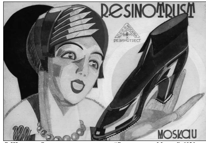
В. Штраних. Эскиз рекламного плаката “Резинотризм. Москва”. 1920-е гг.