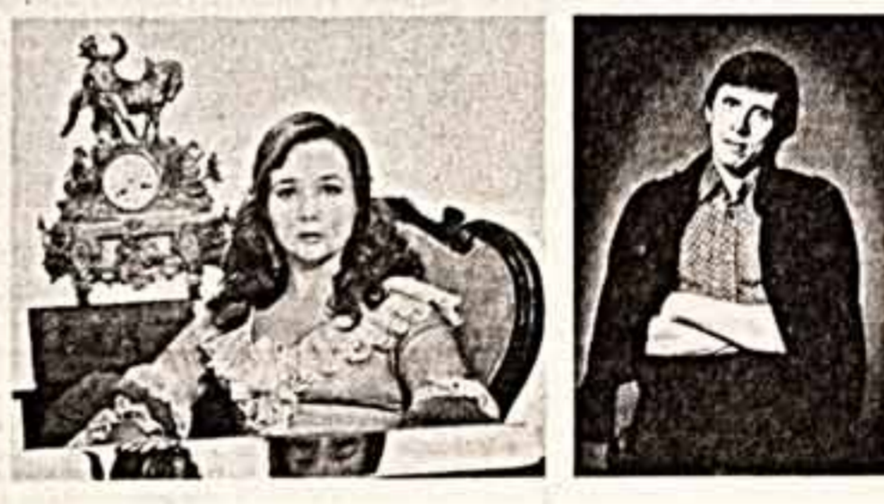
Интервью взяла Н. ЛОРДИКПАНИДЗЕ.