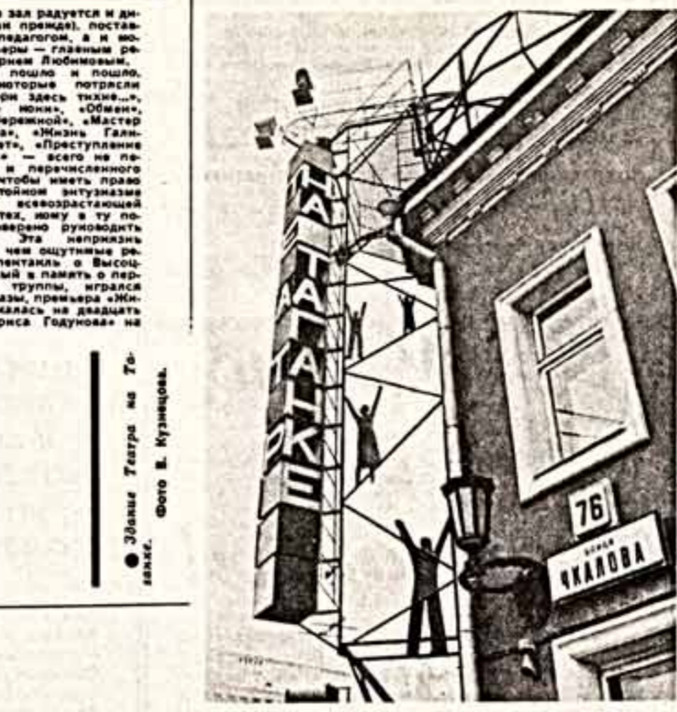
Здание театра на Таганке.