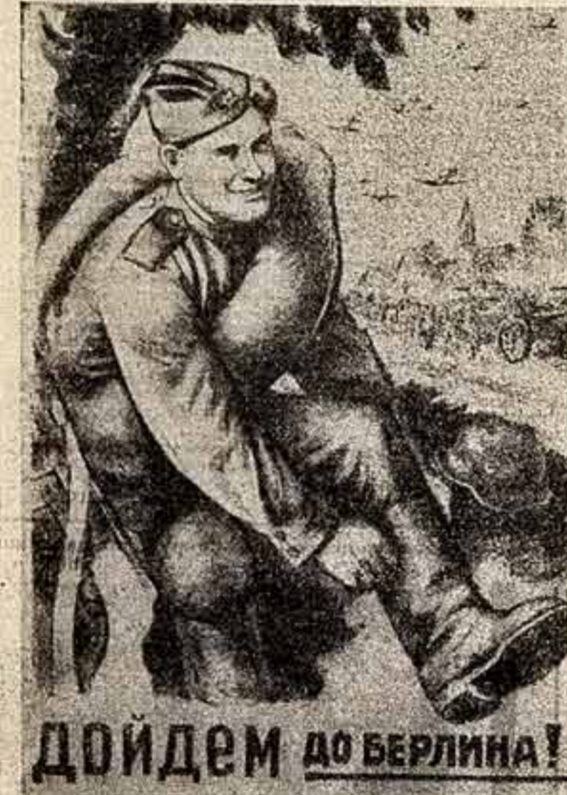
ДОЙДЕМ ДО БЕРЛИНА!

ВРЕМЯ ДАЕТ ПЕРСПЕКТИВУ ВЗГЛЯДА, ДАЕТ ЗРЕНИЕ ЗОРЕВОСТЬ В ТОЙ ВЕЛИКОЙ И СПРАВЕДЛИВОЙ ВОЙНЕ БЫЛ ОПОРОКИНУТ НЕ ПРОСТО ВРАГ — БЫЛ ОПОРОКИНУТ ФАШИЗМ И БЫЛО СПАСЕНО ЧЕЛОВЕЧЕСТВО, ЭТО БЫЛА ВОЙНА НЕ ПРОСТО СТРАН, НЕ ПРОСТО НАРОДОВ — ЭТО БЫЛА ВОЙНА МИРОВ, И ПОБЕДИЛ МИР ГРАДУЩЕГО КОМУНИЗМА. ПОБЕДИЛО НЕ ПРОСТО ОРУЖЬЕ И НЕ ПРОСТО СОЛДАТЫ, ПОБЕДИЛИ ИДЕИ ЛЕНИНСКОЙ ПАРТИИ КОМУНИСТОВ — САМАЯ ПРАВЕДИВАЯ НА СВЕТЕ СИЛА.