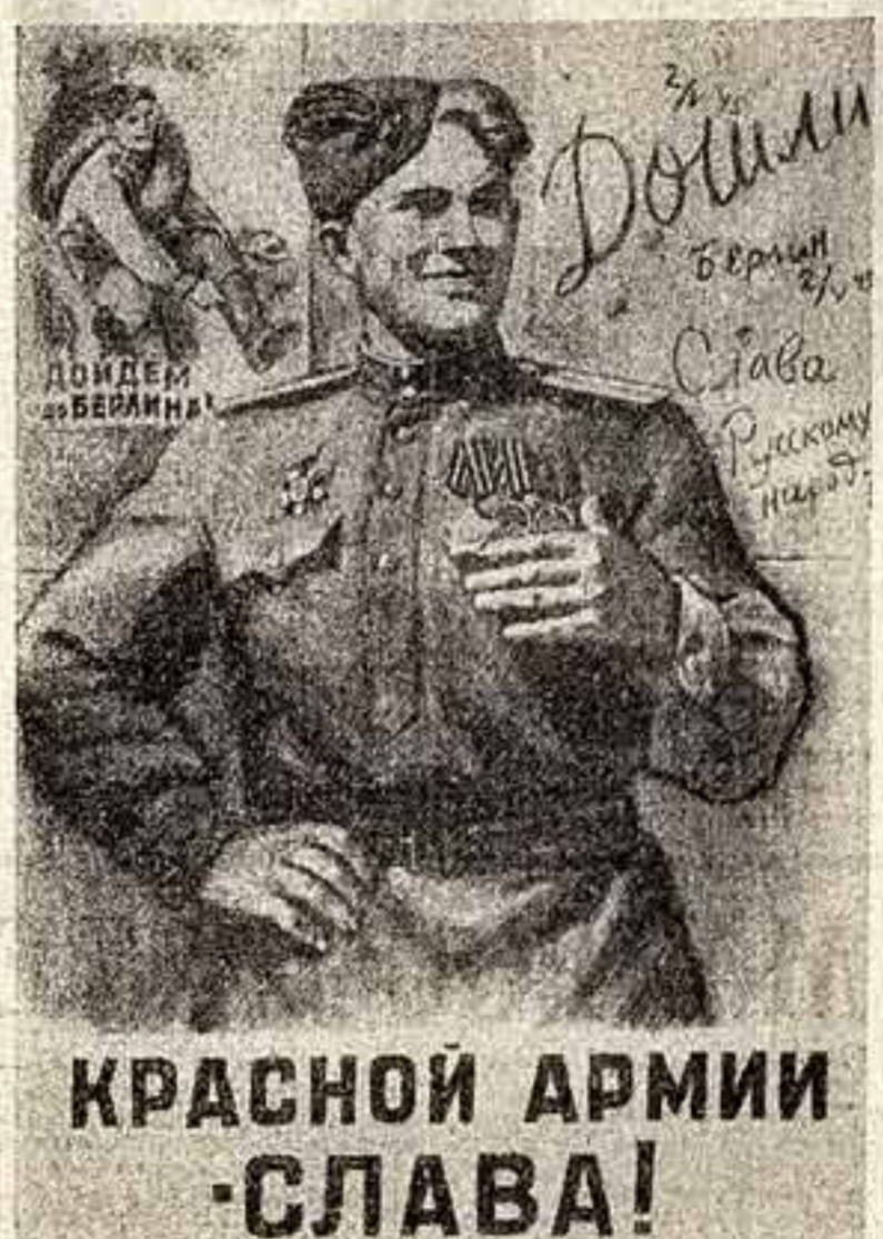
КРАСНОЙ АРМИИ СЛАВА!