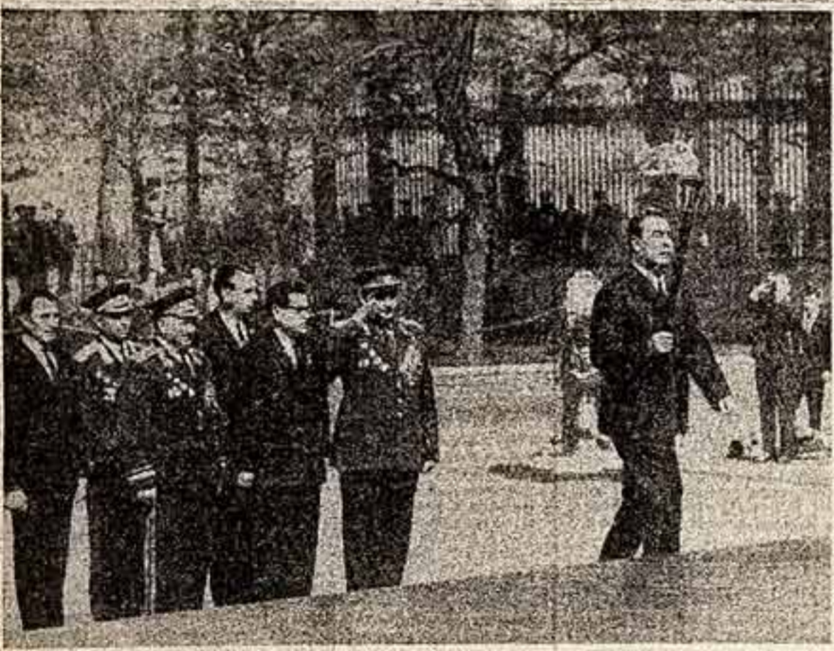
Генеральный секретарь ЦК КПСС Л. Н. Брежнев с флагом, доставленным из города Ленина, с Марсов полк.

ОТКРЫТИЕ ПАМЯТНИКА «МОГИЛА НЕИЗВЕСТНОГО СОЛДАТА»