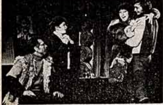
На днях в Ленинградском театре имени Ленинского комсомола состоялась премьера спектакля «История одной любви» А. Тоболкина (постановка Р. Сироты, художник И. Бирула). Пьесу поднимает морально-этические проблемы современной молодежи. Спектакль был тепло встречен зрителями.