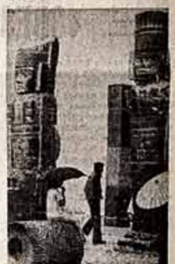
Мексика, одно из крупнейших государств Латинской Америки, — страна богатой древней культуры. На ее территории сохранились многочисленные исторические памятники: пирамиды, ритуальные строения, статуи. Архитектурные памятники в традиционном обычаях мексиканцев привлекают внимание туристов.

В сентябре месяце на прилавках западных магазинов появятся товары, которым спешат помочь на рекламу предприимчивых владельцев. Речь идет о портативных баллончиках со слезоточивым газом. Их назначение — личная защита граждан от возможного нападения вора, грабителя, убийцы. Изготовлены изрядные баллончики с распылителем для дам, более объемные — для мужчин и, наконец, размером с хороший термос — для владельцев автомашин. Новый товар будет продаваться под названием «оружие защиты».