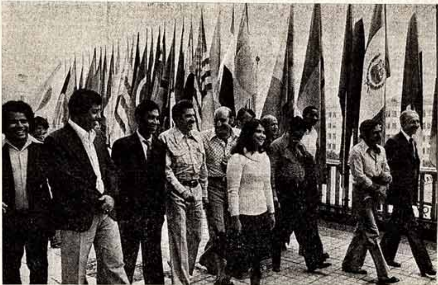
Все флаги — в гости к нам! (Гости и участники X Международного кинофестиваля).

Формирование всех этих правил — процесс тонкий, кропотливый, не терпящий беспечности. На Волгоградском заводе металлообработки имени Сакко и Ванцетти давно уже разработан комплекс правил хорошего тона, которые должны усвоить каждый работник предприятия. Любопытный пример проявления бескультурья здесь не остается без внимания заводского коллектива и строго осуждается. Такой опыт надо всемерно поддерживать и развивать. Необходимо прививать человеку правила хорошего тона и в детском саду, и в школе, и в вузе. Человеческие отношения, быт советских людей постоянно совершенствуются в ходе коммунистического строительства. Культура поведения возрастает вместе с духовным и материальным богатством общества. Воспитанию лучших качеств в человеке и должна способствовать марксистско-ленинская эстетика в союзе с искусством, литературой, педагогикой.