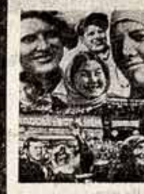
Кадр из фильма «Я — гражданин Советского Союза».