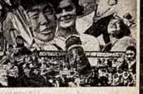
Кадр из фильма «Я — гражданин Советского Союза».