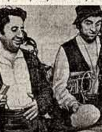
Имя болгарского актера Наума Шопова хорошо известно советскому зрителю.