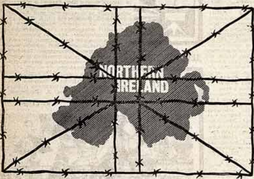
Armored cars and tanks and guns, Come to take away our sons, But everyone must stand behind, The men behind the wire.