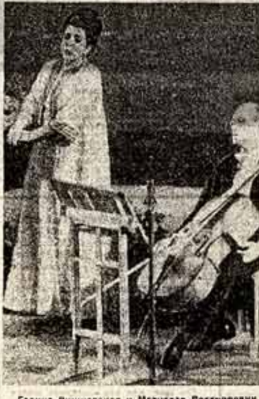
Галина Вишневская и Метислав Ростропович.

станавица (или наоборот, если хотите). Певалью думалось, сколько же близких, родственных связей, восторга в конце концов вершинные проявления человеческого гения!