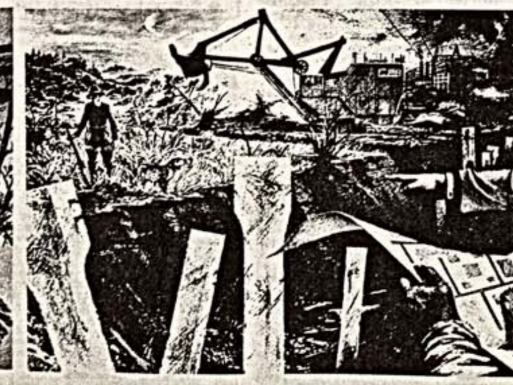
А. Лопатин, «Преображение».