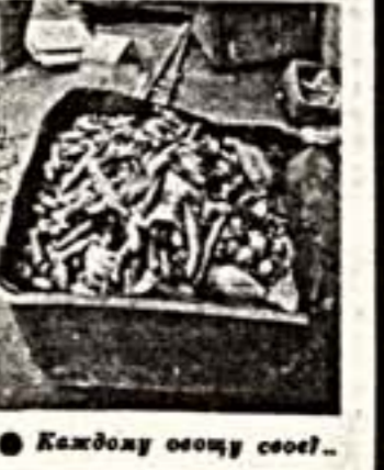
Каждому осязу свое!

Исчезли штурмовые отряды и винные отделы, толпы у контейнеров с мукой и крупой. Они парализованы в домоуправлениях. Именно там выдвигаются талоны. Однако, приняв столь болезненное для минчан решение, горсовет недостаточно продумал его обеспечение. Разумеется, такой объем дополнительной работы не под силу немногочисленным слу-