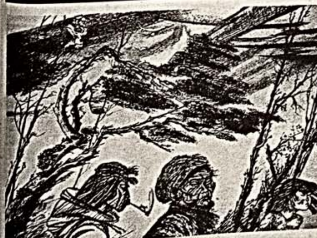
В. Крайнов, «Снова дует ветер с моря».