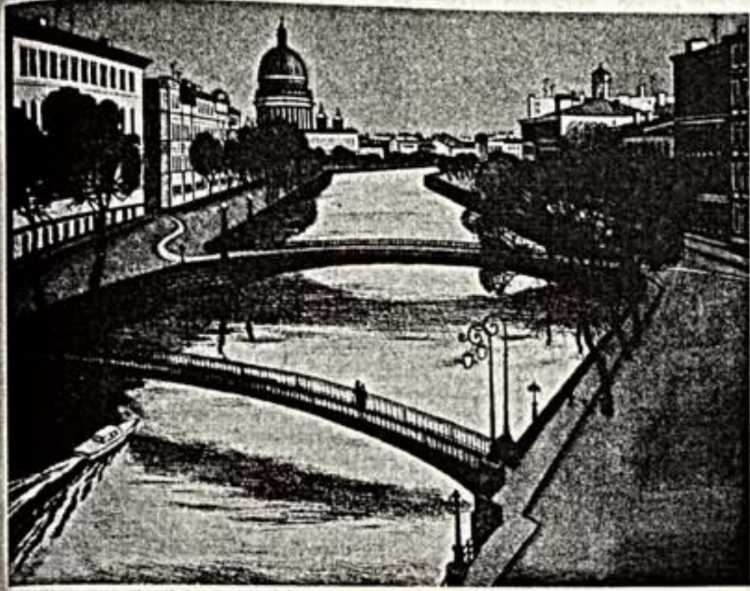
О. Пермяков. Из серии «Ленинград. Город белых ночей».