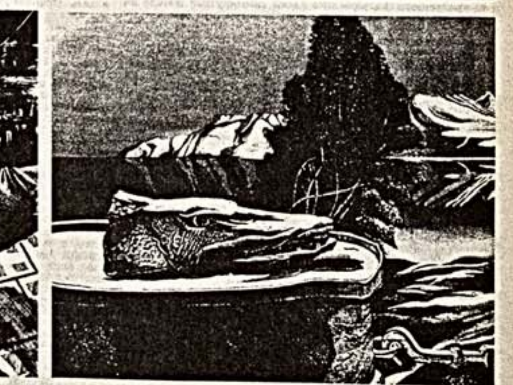
И. Лаврова, «Путешествие по Уралу».