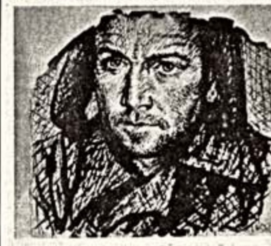
Ю. Соостер. Заключенный в ушанке. 1953 г. Долинка. Гос. ярмарка СССР. Суверки. 1946 г. Колымка.