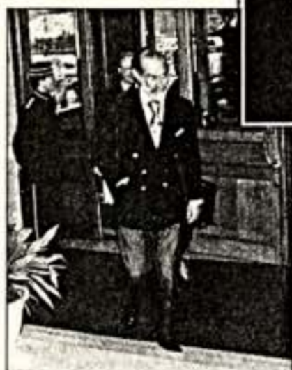
Как и прежде, в «Национале» любят останавливаться выдающиеся деятели культуры и искусства, видные зарубежные политические и общественные деятели: Пьер Устинов, принц Майка Кеетский, президент Польши Александр Квасьневский, Джанфранко Ферре