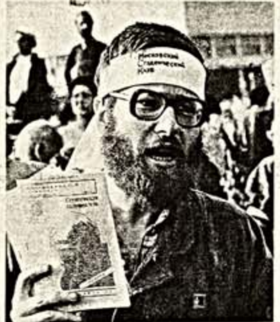
Юрий Черниченко, секретарь правления СП СССР...