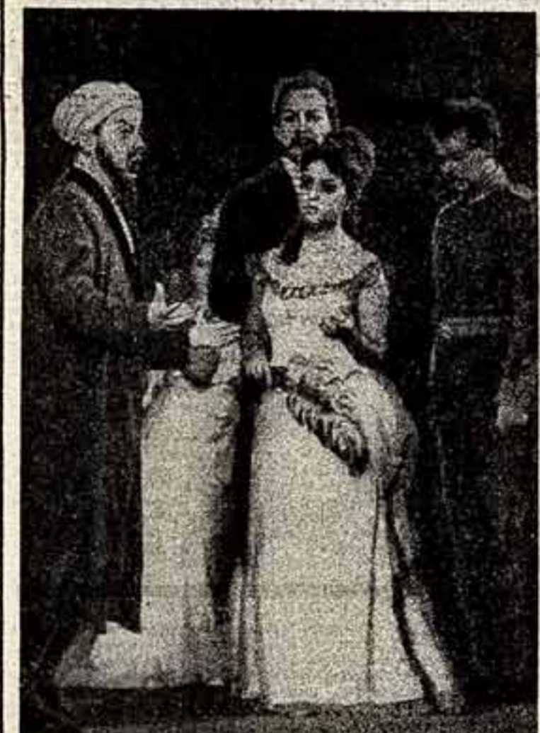
Оперой М. Ашрафи «Сердце поэта» начал свои гастроли в Москве Государственный оркестр Трудового Красного Знамени академической Большой театр Узбекской ССР имени А. Шайхона Навои. В дни культуры и искусства Узбекской ССР в Москве театр покажет спектакли «Спартак», «Свет во мраке», «Сорок девушек».