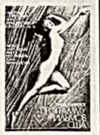
уже втягиваются и кинематографы других стран. Существуют проекты...

Вопрос режиссеру конкурсного фильма «Возвращение» Им Кван Таку (Южная Корея): Что вы можете сказать о дебюте южнокорейского кинематографа на московском международном кинофестивале?