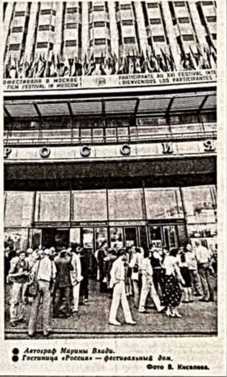
Автограф Марии Влади. Гостилица «Россия» — фестивальный дом.

МЕЖДУНАРОДНЫЙ КИНОФЕСТИВАЛЬ 1989 МОСКВА Материалы о кинофестивале читайте на 4 странице