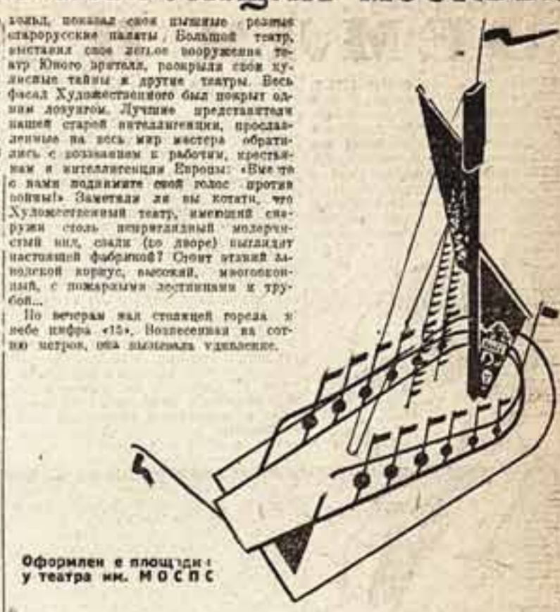
Оформлен в площади у театра им. М. Горького