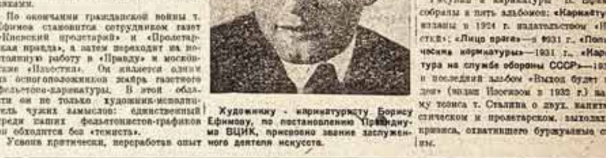
Борис Ефимов — карикатурист