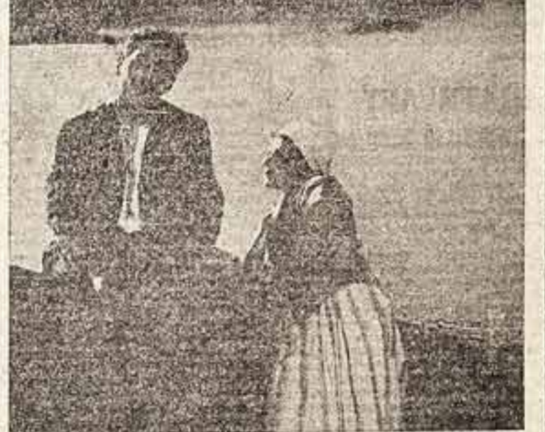
Надпись на фельдм «Встречы»