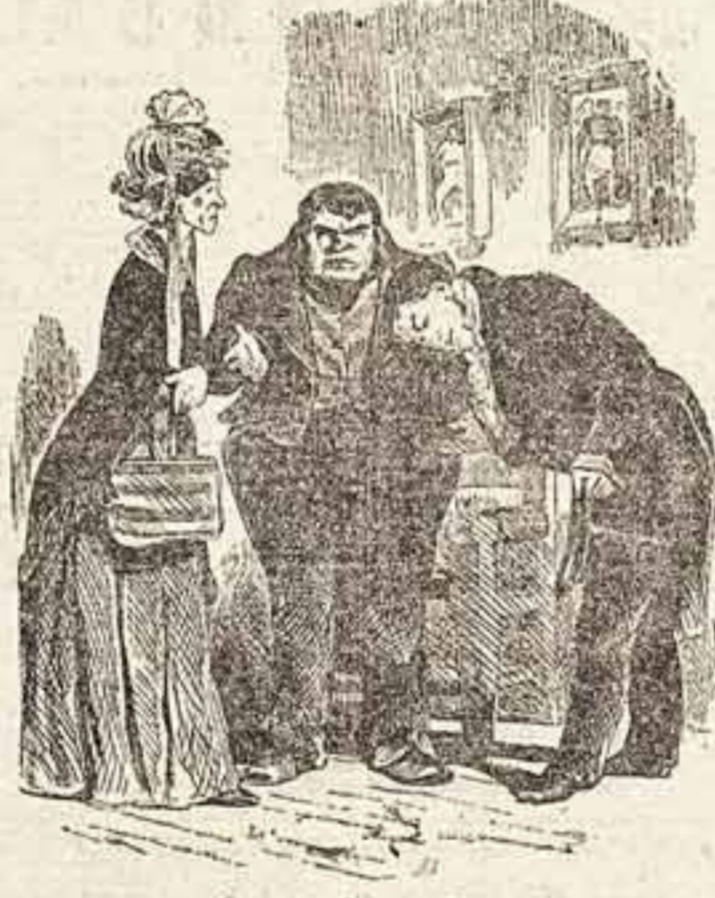
— Это мол Федора Некрасов! Из старинных иллюстраций к «Мертвым душам».