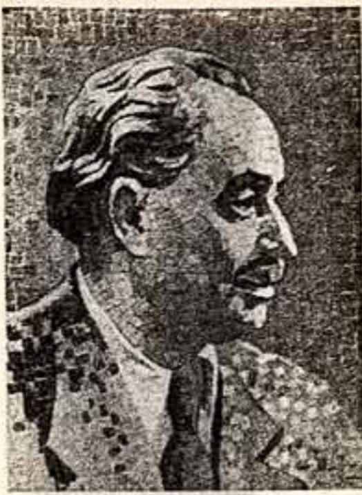
И. Ненов. «Георгий Димитров». Мозаика.

— Я не чувствую себя иностранцем в нашей стране, — улыбаясь заключил беззаботно гость из Ганы.