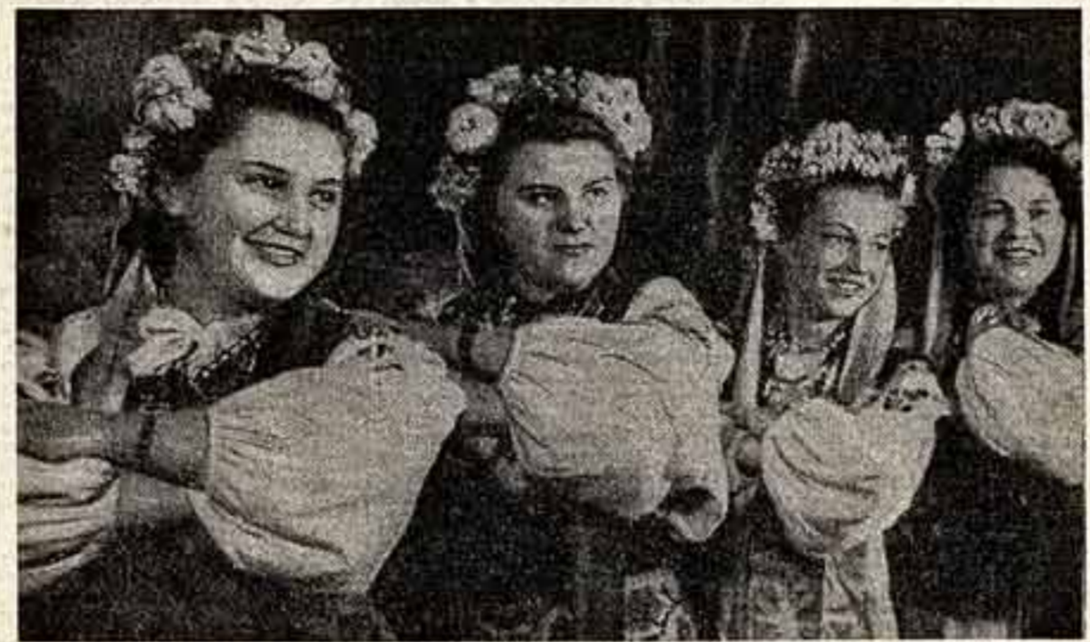
Многие дома культуры, клубы, библиотеки, красные уголки Белгородской области превращены в подлинные центры массово-политической и культурно-просветительной работы среди населения. Больших успехов органы культуры области добились в разветвлении художественной самодеятельности трудящихся. На снимке: танцевальный коллектив Работянского сахарного завода.

№ 30 (899) Четверг, 5 марта 1959 года Цена 40 коп.