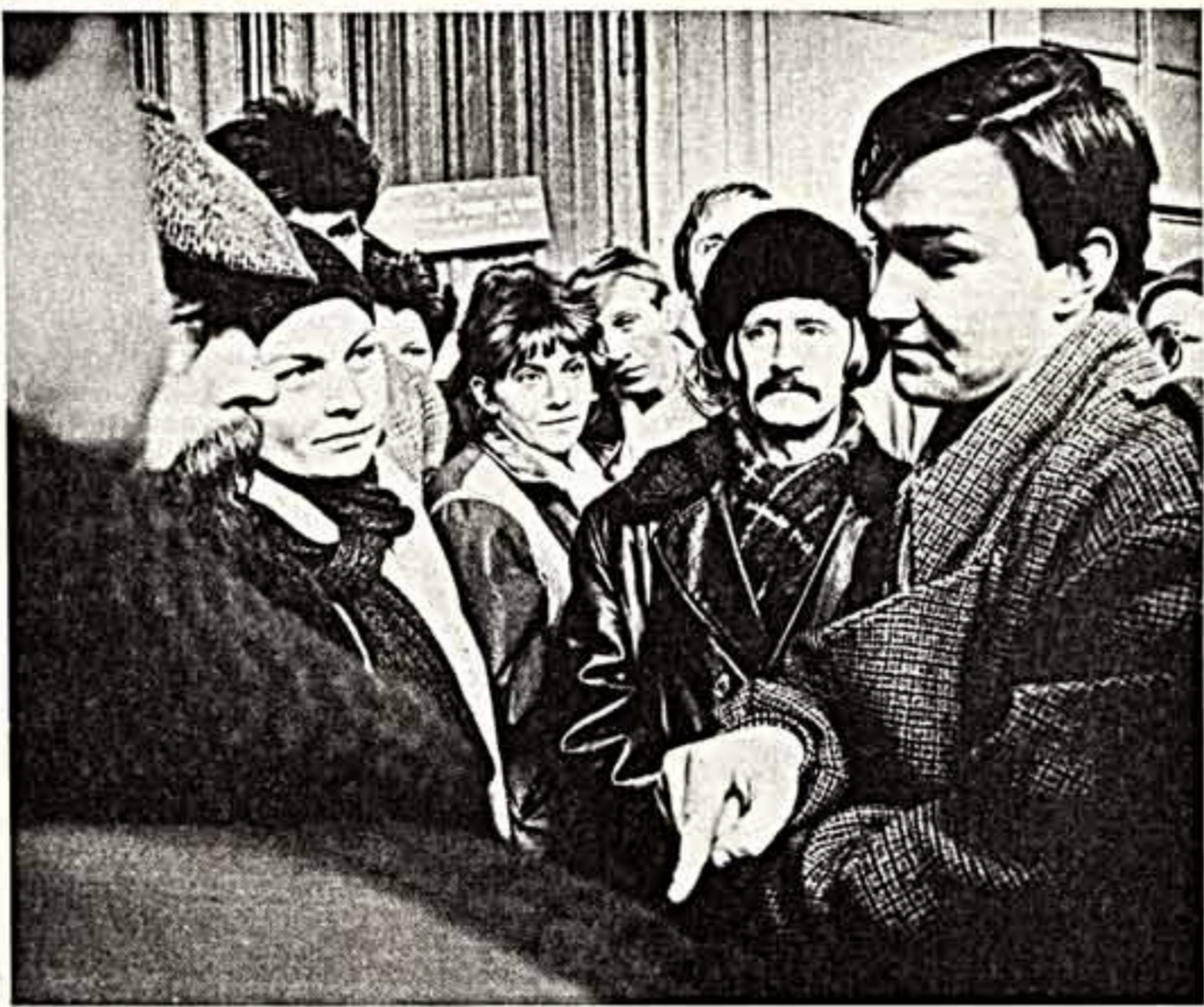
● Кто станет депутатом? Этот вопрос волнует сегодня многих избирателей, в том числе и этих молодых людей, которые 26 марта предстоит выбрать народному депутату по Красноярскому району территориальному округу № 11 города Москвы.

Другим творческим союзам еще предстоит выбрать своих депутатов. Рассказы о выборах, их предвыборные платформы — на 2-й странице.