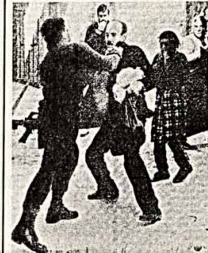
В весенний день 9 Марта рудники многих стран мира выйдут на демонстрации, которые их одаривала другая половина человечества. Но так было не всегда.

Владислав ДУНАЕВ. (Соб. корр. АИИ и «Советской культуры».)