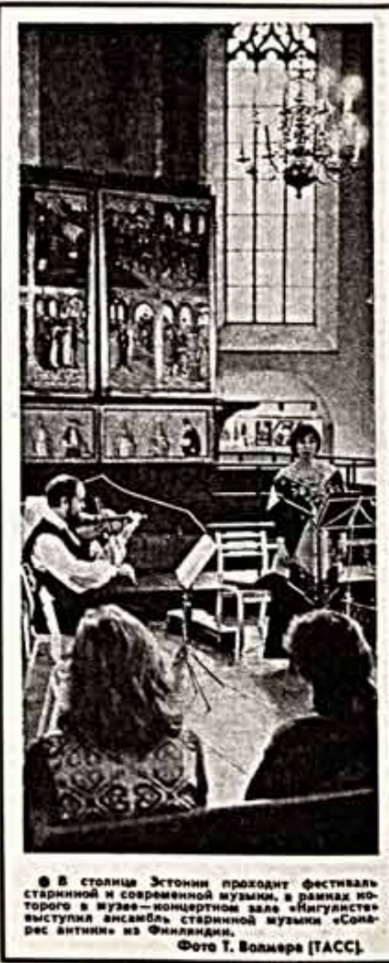
В Столице Эстонии проходит фестиваль старинной и современной музыки, в рамках которого в музее-концертном зале «Лигуистика» выступил ансамбль старинной музыки «Сомаре антини» из Финляндии. Фото Т. Волмера [ТАСС].