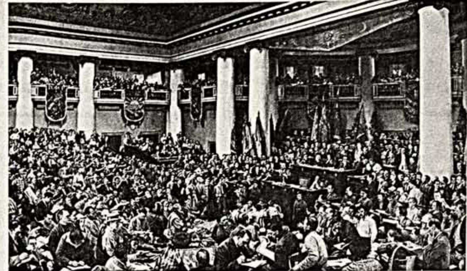
Н. БРОДСКИЙ. «Торжественное открытие II конгресса Коминтерна».