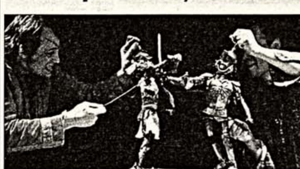
Сцена из спектакля “Король и три его дочери”