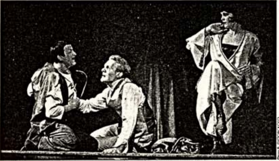
Сцена из спектакля “Зойкина квартира”