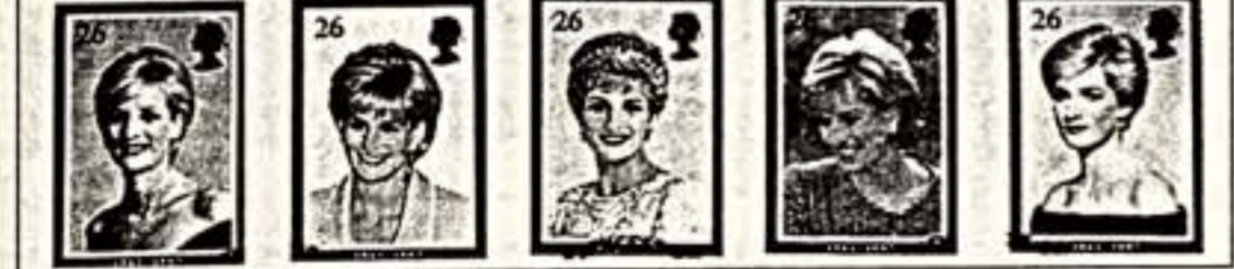
Слева: Эту фарфоровую куколку "Принцесса Ди" можно купить и в рассрочку. Сверху: Марки, посвященные памяти погибшей

траурный зал - фотографии и разные предметы рассказывают о трагической смерти принцессы. Отдельное помещение посвящено истории семьи Спенсеров. Рядом предполагается расположить большой магазин сувениров.