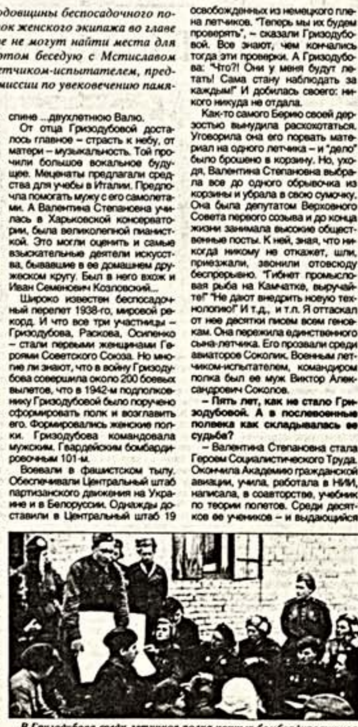
В.Гризодубова среди летчиков полка ночных бомбардировщиков